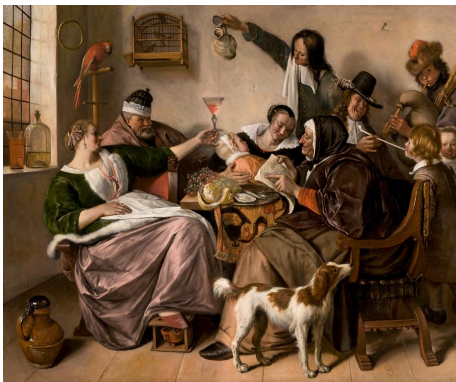
4. Jan Steen: Ahogy az öregek énekelnek, úgy füttyülnek a fiatalok, 1668–70 k. olaj, vászon, 134 × 163 cm, Hága, Mauritshuis