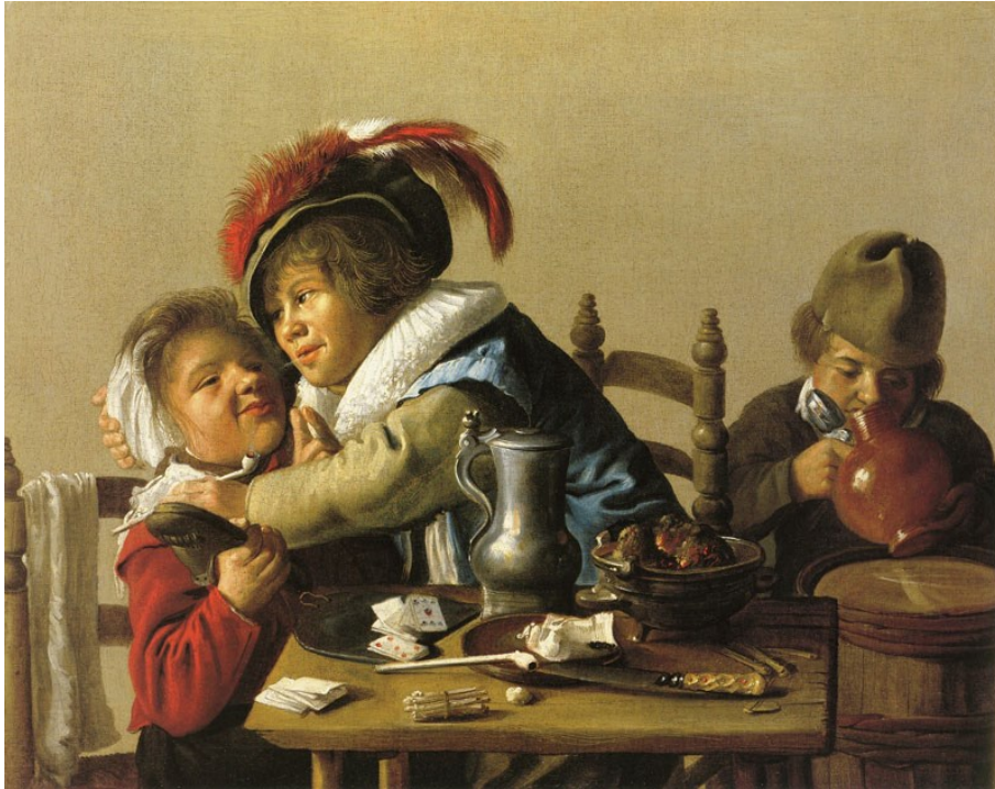
1. Jan Miense Molenaer: Három gyermek egy asztalnál , 1628-29 k. olaj, vászon, 46 × 61 cm, Magángyűjtemény

Habár feltehetjük, hogy volt példa ilyesfajta viselkedésmódra, a holland zsánerképeken felbukkanó motívumok gyakorisága, tipizáltsága azonban azt sugallja a nézőnek, hogy többet lát annál, mint ami első pillantásra egyértelmű olvasatot kínál.