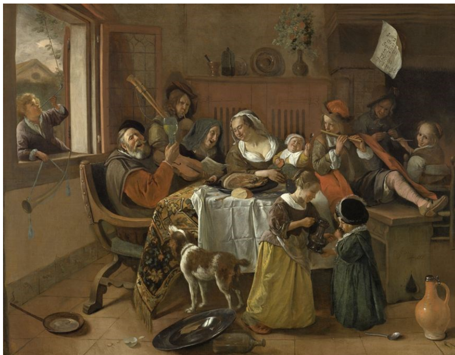
3. Jan Steen: Vidám társaság, 1667 olaj, vászon, 110,5 × 141 cm, Amszterdam, Rijksmuseum