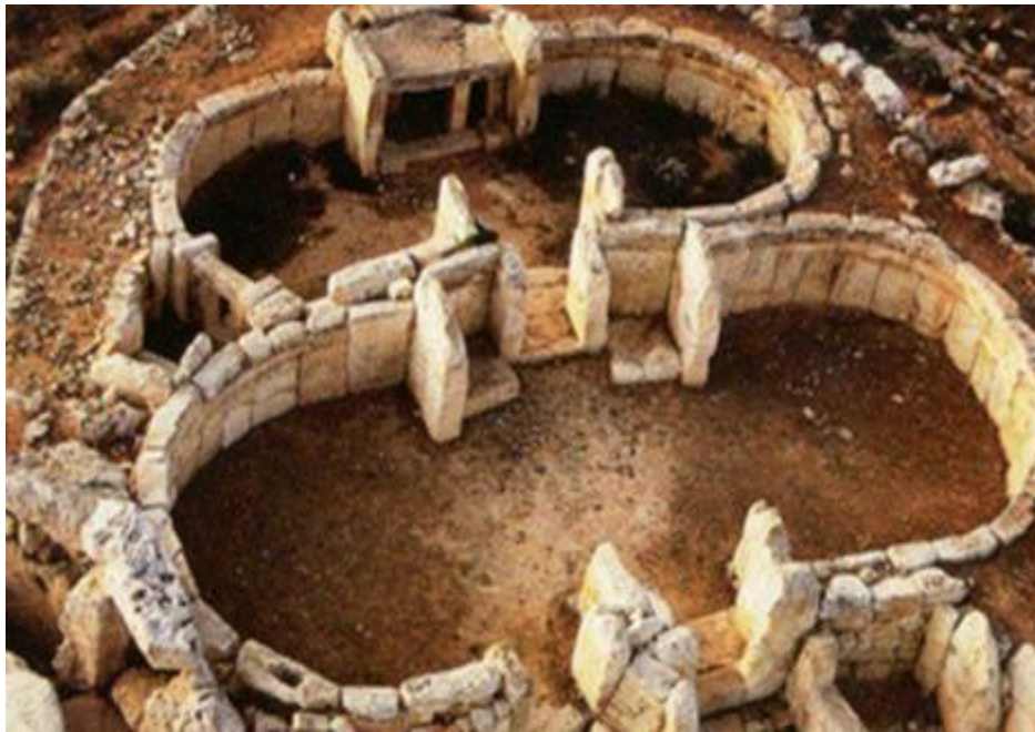
2. ábra: Çatal Hüyükben feltárt épületek

( http://www.noportal.hu/main/npnews-14520.html )