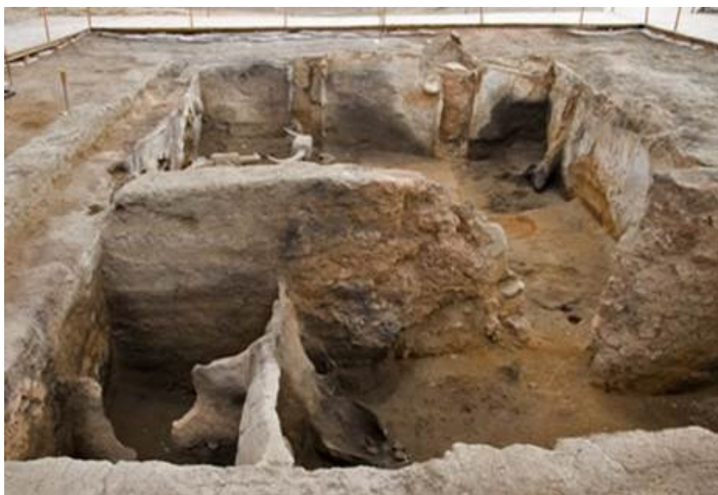
3. ábra: A feltárt lakószintek

lakhelyek. Minden házban külön lakó- és dolgozóhelyiségek találhatók. A házak belső falát gazdagon díszítették faliszőnyegekkel, falfestményekkel és szobrokkal. Bár templom maradványait nem találták meg, a leletek azt sugallják, hogy a Çatal Hüyük-i hit bővelkedett szimbólumokban. A falfülkébe és a gabonatóró edényeikbe jellegzetes terrakottafigurákat helyeztek, valószínűleg rituális védelmi céllal (bővebben lásd: http://server.catalhoyuk.com ). Çatal Hüyük egyik legérdekesebb jellemzője a rétegződése. Amint a 3. ábra mutatja, amikor egy ház alkalmatlanná vált a használatra, tulajdonosai lebontották a tetőt és a falakat, majd a ház alsó szintjét gondosan feltöltve, ugyanazon a helyen építettek új otthont. A legnagyobb földhalomban a régészek 14 egykori lakószintet találtak egymás tetejére építve. Az eddig feltárt leletek alapján a jelenleg ismert legnagyobb és legkifinomultabb neolitikus település rajzolódik ki előttünk (Stevanovic 2003).