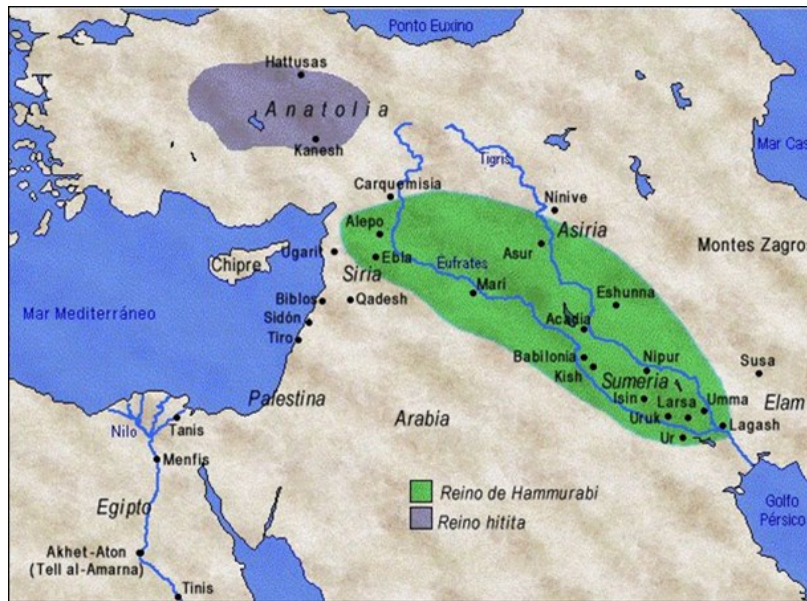
Az Óbabiloni Birodalom és a sumér városállamok Hammurapi idején

Ékszereik, fegyvereik megmunkálása, épületeik kialakítása számos szakma igényes és magas szintű szakértelmét feltételezik (Mészáros–Németh–Pukánszky 2002, 18–19).