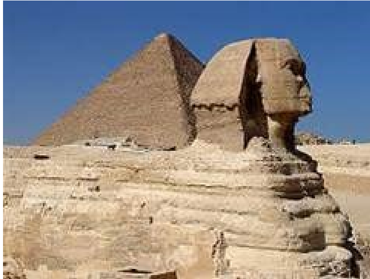
6. ábra. Kheopsz fáraó (Kr.e. 1551-1528) piramisa, előtérben a Szfinxszel

Forrás: http://teszerakt.uw.hu/Teszerakt%20Sci-fi%20Klub/Kheopsz.htm