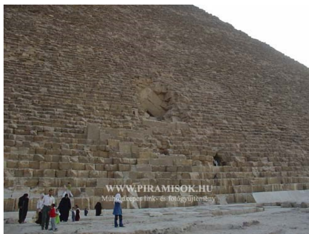
7. ábra. Kheopsz fáraó piramisának részlete

A piramisokat az Óbirodalom korában emelték a Kr. e. 3. évezred első felében. Építésük körül ma is sok a rejtély. Elég egy pillantást vetnünk a 7. ábrán látható piramis részletére. Hogyan voltak képesek az akkori emberek Kr. e. 2500 évvel (!) kő- és rézeszközök segítségével – elektromosság, hidraulikus és pneumatikus emelőrendszerek, műszerek stb. nélkül – milliméter pontosan megfaragni 2–3 tonnás kőtömböket (tökéletes derékszögeket alkotva!), majd hogyan tudták ezeket a gigantikus kőkockákat a helyszínre szállítani és helyükre illeszteni? Igazából még ma sem tudjuk, csupán teóriáink vannak. Azt azonban ma már kijelenti a történettudomány, hogy ezeket a gigantikus építményeket nem kényszer hatására rabszolgákkal emeltették, hanem szabad emberek önkéntes alkotásai voltak (Harmat 2014).