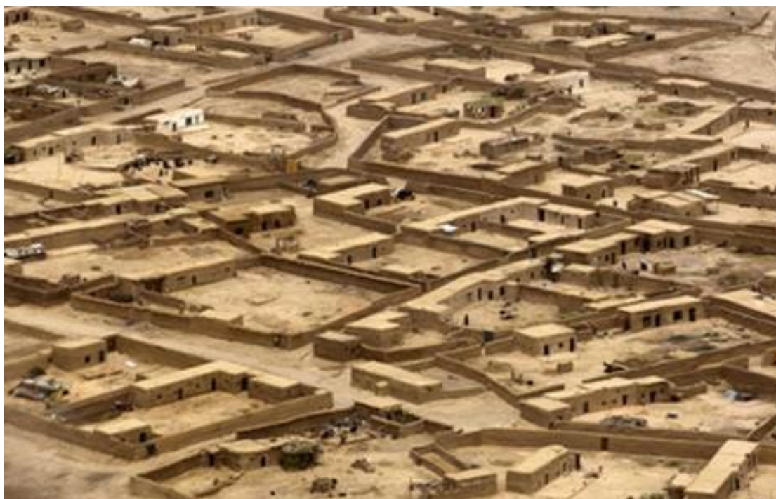
1. ábra: Çatal Hüyük, a feltárt legősibb város

A törökországi Dél-Anatóliában található Çatal Hüyük története Kr. e 7500-ig nyúlik vissza. Ezen az ókori településen több ezer ember élt együtt generációkon át (Soldi 2006, 19). Az I. ábrán a feltárt település egyik részletét láthatjuk.