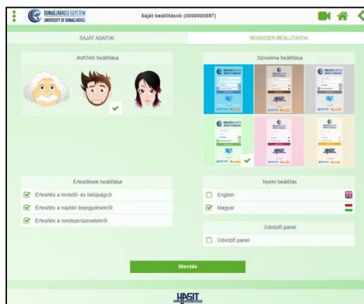
2. ábra. Egyéni AVATAR-beállítások

TAR-profilját: kiválaszthatja a neki tetsző figurát, az oldal színét, a felhasználói nyelvet (külföldi hallgatókra való tekintettel angolul is elérhető), illetve azt, hogy miről szeretne értesítéseket kapni (2. ábra).