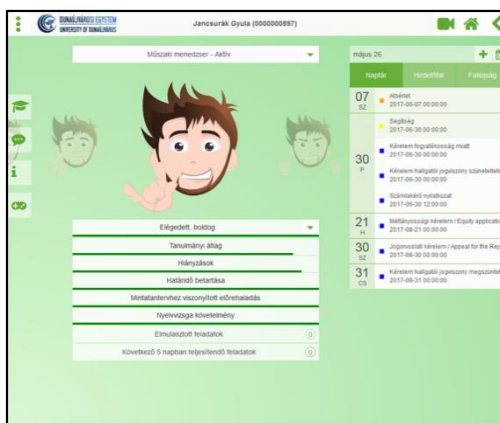
1. ábra. Elégedettségi állapot jelzése

A programhoz minden egyetemi oktatónak és beiratkozott hallgatónak ingyenes hozzáférése van, a belépéshez csupán az egyéni Neptun-kód szükséges. A rendszer minden olyan forrás adatait feldolgozza és beépíti, ami a hallgatóval vagy az oktatóval kapcsolatos: információkat szűr le a Neptun és Moodle alapján, valamint a Tanulmányi Osztály és a hallgatókhoz rendelt szakmentorok bejegyzései szerint. A program elsődleges célja, hogy azonnali és jól értelmezhető képet adjon arról, hogy a hallgató – a korábban megállapított indikátorok alapján – éppen hogyan áll a tanulmányaival, feladataival, a tantárgyak teljesítésétől a hiányzásokon át a vizsgákkal és egyéb tanulmányi ügyekkel kapcsolatos teendőikig. A rendszer az összteljesítményt egy hétfokú érzelmi skálához hozzárendelt AVATAR-figurával is szemlélteti, aki arckifejezésével rögtön jelzi a belépőnek az aktuális elégedettségi állapotot (1. ábra).