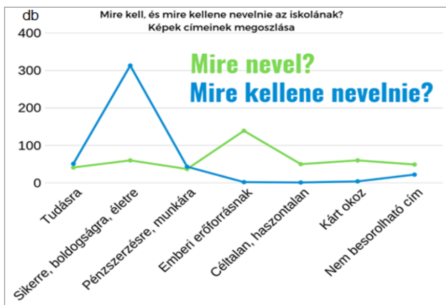
2. sz. ábra: Mire nevel és mire kellene nevelnie az iskolának? Címek megoszlása. (N=436)

Ennél is szembetűnőbbek a különbségek, ha egyetlen grafikonra rajzoljuk a válaszok megoszlását (2. ábra):