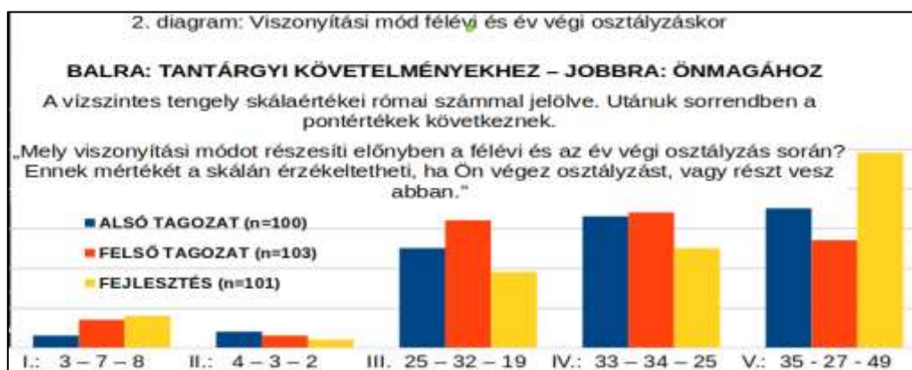
2. sz. ábra: Viszonyítási mód félévi és év végi osztályzásokor a tantárgyi követelményekhez és önmagához

Az 1. sz. ábrán látható, hogy a pedagógusok legtöbbször (1/3-a) a skála 3-as fokozatát választotta az osztályozás során. A módusz tehát közepen van, de némi túlsúly mutatkozik a csoporthoz viszonyítás oldalán (IV.: 21,7, V.: 21, 1 %). Előnyösebb volna, ha túlsúly a bal oldalon volna. A vélemények megoszlanak, de némi eltéréssel a három pedagóguscsoport vélekedése párhuzamos.