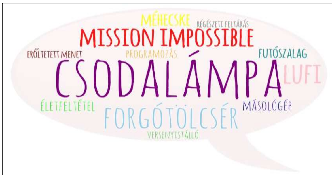
4. sz. ábra: Egyedi válaszok a gyermeki tanulásról a metaforaelemzés során