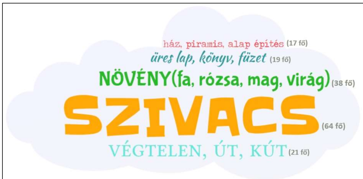
3. sz. ábra: Hogyan vélekednek a szülők és az óvodapedagógusok a gyermeki tanulásról a metaforaelemzés során

építve a kérdések közé a metaforaelemzéshez szükséges befejezendő mondatrész. Azt kértem, hogy egészítsék ki egy jelzős szerkezettel vagy szóval, „ a gyermekek tanulása szerintem olyan, mint... ”