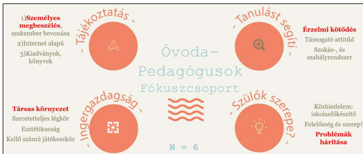
2. sz. ábra: Az óvodapedagógusok összesített véleménye (Forrás: Saját szerkesztés)

esemény. A fókuszcsoportos beszélgetés során megismertem az óvodapedagógusok véleményét.