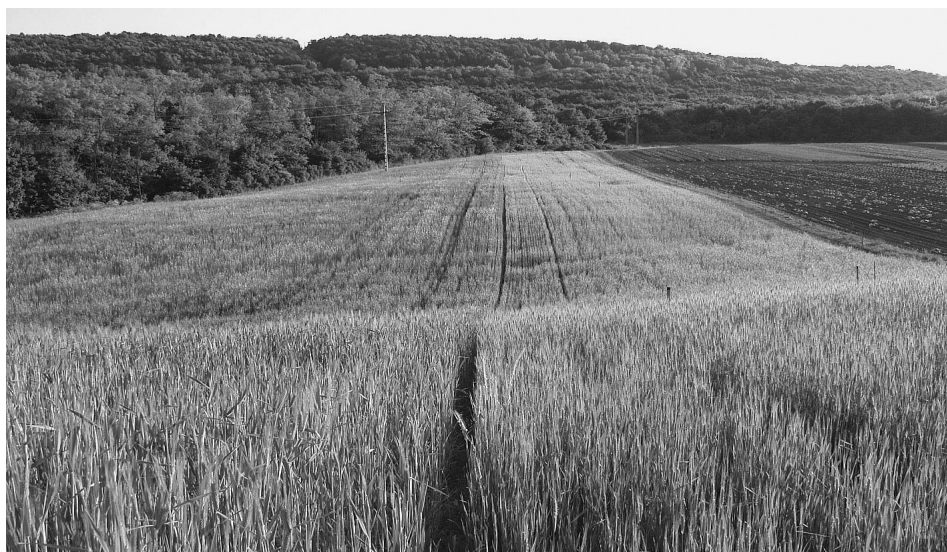
1. ábra Az alakor (jobb oldal) és a tönke (bal oldal) virágzás előtt (2011. május 30.) Figure 1. Einkorn (right side) and emmer (left side) before flowering (30 st May 2011.)

A tönke ( Triticum turgidum ssp. dicoccum ) a neolitikum óta az egyik legfontosabb pelyvás gabona, a durum búza őse. A közel-keleti népek legfontosabb gabonaféléje mintegy 10.000 éve, a mediterrán országokban napjainkban is használják. Hazánkban az alakorhoz hasonlóan a hegyvidéki szántók növénye volt a 19. század közepéig (GYULAI 2009).