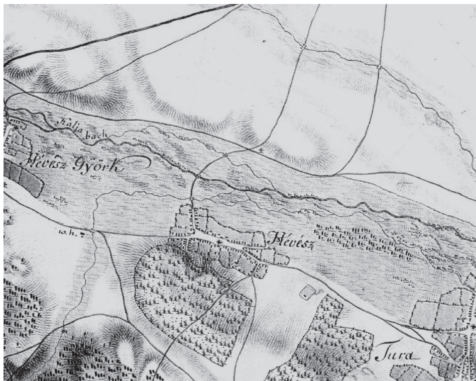
1. ábra Galgahévíz (Hévesz) település az I. katonai felmérésen (1789)

belső rész telkeitől. A Galga-patak „Kalja bach” néven szerepel az 1789-ben készített térképen (1. ábra), ebbe csatlakozik a Galgahévíz településtől nyugatra, a lejtősebb területéről érkező Sósi-patak, amelynek a neve akkor még nem szerepelt a térképen. A Sósi-patak ábrázolása azért is kiemelt fontosságú, mert akkor még a természetes medrében folyt, és a település jól láthatóan csak addig a pontig terjeszkedett észak felé, amíg el nem érte a vizek kiöntésének határát, azaz addig a pontig, ahol a Sósi-patak, a lejtős területről leérve kelet felé fordul és eléri a környék legmélyebb pontját.