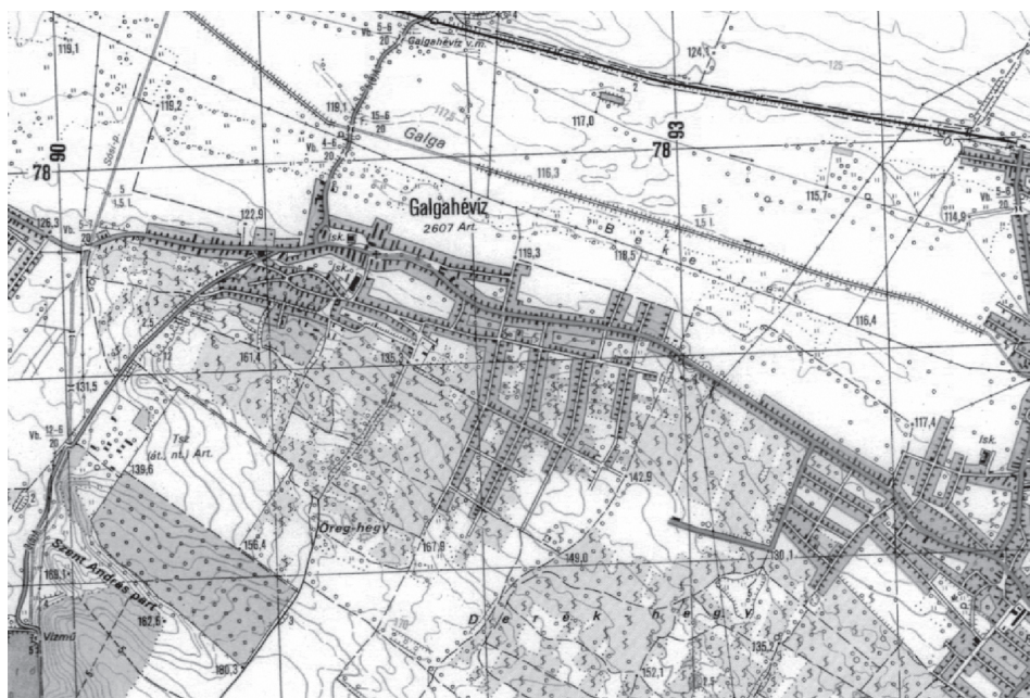
4. ábra Galgahévíz település a IV. katonai felmérésen (1990) Figure 4. Galgahévíz settlement on the fourth military survey map (1990)