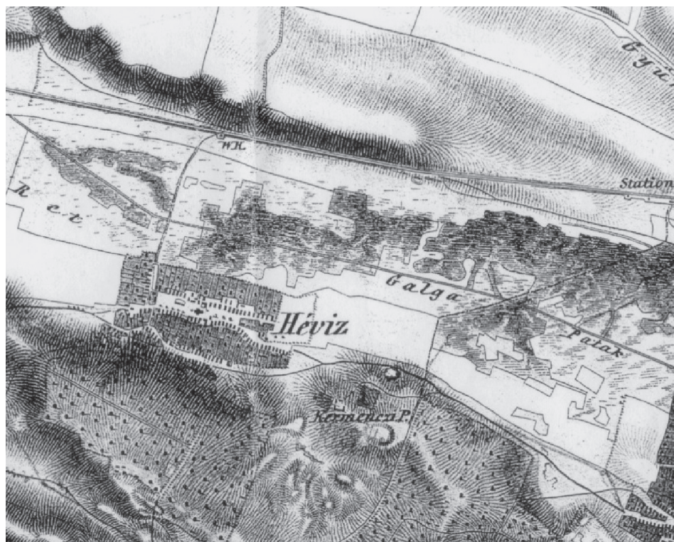
2. ábra Galgahévíz (Hévíz) település II. katonai felmérés (1852)

A 18–19. században végrehajtott tervszerű falurendezések nagymértékben átformálták a faluhálózatot és az utcaképet. Ez a rendezés azonban meghatározott irányú volt, így nem tüntetett el minden korábbi faluszerkezeti elemet (1. ábra).