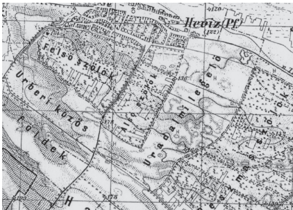
3. ábra Galgahévíz (Heviz (Pf.)) település a III. katonai felmérésen (1883) Figure 3. Galgahévíz (Heviz (Pf.)) settlement on the third military survey map (1883)