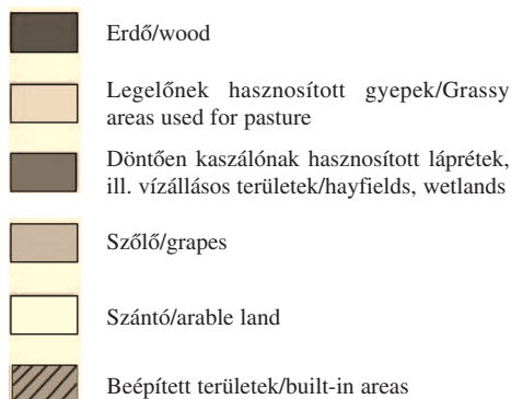
5. ábra Tájhasználat napjainkban 1=Nagyléta, 2=Vértes, 3=Mosonta-kert, 4=Kossuth-kert, 5=Bocskai-kert Figure 5. Land use today. 1=Nagyléta, 2=Vértes, 3=Mosonta-garden, 4=Kossuth-garden, 5=Bocskai-garden