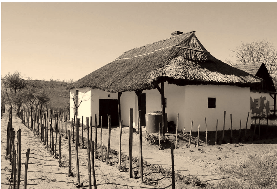
6. ábra A Mosonta-kert Átok-dűlőn fekvő egyik szőlőspajtája Figure 6. Wineyard-barn in the Mosonta-garden (Átok-balk)

A szőlőskertek legjellegzetesebb – a munkálkodás és a rövid tartózkodás – építményei a pajták (6. ábra).