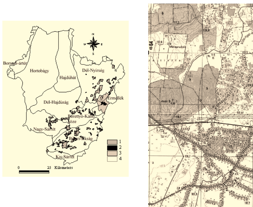
1. ábra A Mosonta-kert elhelyezkedése

Hajdú-Bihar megyében, Létavértes északi külterületén, a Dél-Nyírség peremén találjuk a Mosonta-hegy szőlőskertjét, amely – etnográfusaink szerint – az alföld népi építészeteinek egyik – országosan alig ismert – kincses szigete (1. ábra).