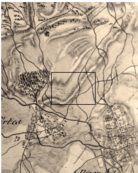
2. ábra A terület ábrázolása az I. katonai felmérés (1782–1785) térképén (Colonne XXV. Sec.19.)

nem nőtt jelentősen, helyette a belterjesség (trágyázás) irányába történt elmozdulás. Az átlagos szántóméret 8 hektár körül alakult. A korábbiakhoz képest növekedett a kukorica vetésterülete, és ezzel összefüggésben a haszonállatok száma.