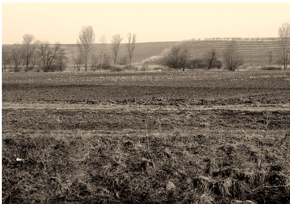
2. ábra A galgahévízi mintaterületek Figure 2. Sample sites of Galgahévíz

rendszerint változtatták, hátrahagyva durvaszemű üledékeiket, amit azután vagy ők, vagy más, a helyükre terelődő folyók szállítottak tovább, vagy halmoztak át. Amíg a szintváltozások közvetve terelték a vízfolyásokat, addig a kiújuló haránttörések közvetlenül is, preformálás révén magukhoz vonták a felszíni vizeket. Ilyen törésvonal mentén fut ma a Galga, de a Tápió is. A szintváltozások ma sem szünetelnek (2. ábra).