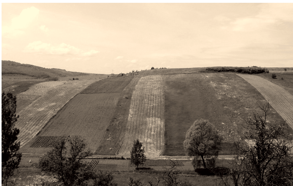
1. ábra Az alsószuhai mintaterületek Figure 1. Sample sites of Alsószuha

nak, a szántóföldi növénytermesztésnek és a kevésbé hőigényes, nem fagyérzékeny kertészeti kultúráknak. A megfelelő vetésszerkezet a biológiai és tájképi változatosság mellett a talajerő megtartása és az erózió elkerülése végett is fontos. A térség földhasználatát jelenleg leginkább a gyepek és az erdő művelésmódok jellemzik. A szántott területek átlagosan 10%-ot tesznek ki, helyenként ennél is kevesebbet (1. ábra).