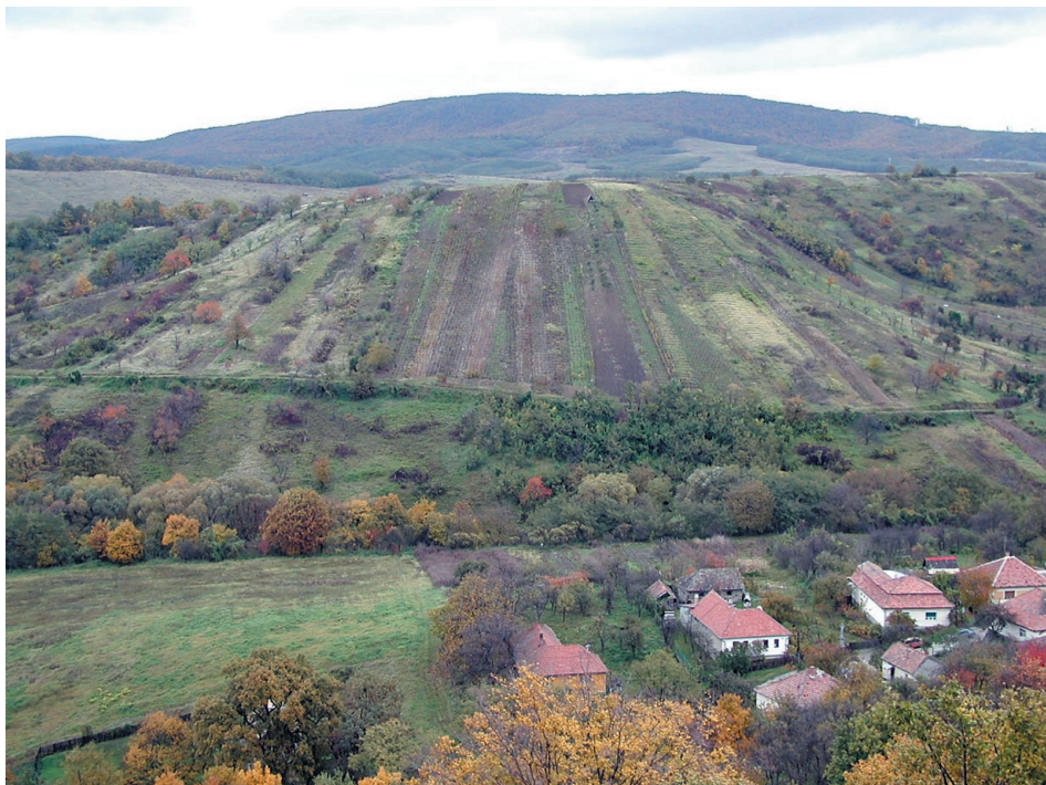
6. ábra Szalagparcellás természetföldek (Öregszőlők) Figure 6. The structure of narrow stripes of arable land (Öregszőlők)