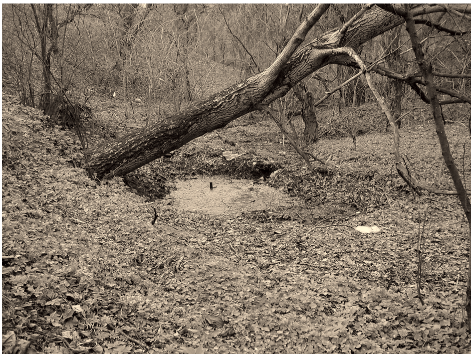
4. ábra Egykori mosótó a Hollókői-patak mentén Figure 4. Former washing pond along the Hollókő Stream