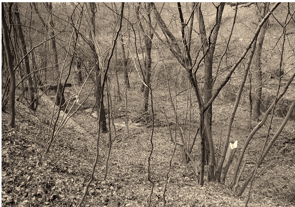
2. ábra Az egykori „parasztfürdő” maradványai Figure 2. Remnants of the former open air bath used by locals

Az elmúlt húsz évben a hollókői táj – elsősorban agrártörténeti – emlékeinek jelentős része végveszélybe került. A fás legelő – mint tájhasznosítási forma és mint jelentős tájképi elem – gyakorlatilag eltűnt, legeltetésével teljesen felhagytak. A fás legelők területe fokozatosan beerdősült – ez a folyamat napjainkban is tart. A zártkert kisparcelláinak többsége évek óta műveletlen, a gazdálkodással felhagytak, különösen igaz ez a Pusztaszőlők és a Nedám-hegy földjeire. A műveletlen területeken megindult a gyomosodás, cserjésedés-erdősülés folyamata. Az egykori parasztfürdő területét visszafoglalta az erdő, csak hosszas keresgélés után található meg az érdeklődő turista (2. ábra).