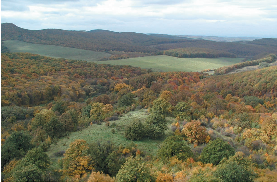
5. ábra A fás legelő megmaradt részlete a Várhegy oldalában Figure 5. Detail of the wooded pasture left at Vár Hill