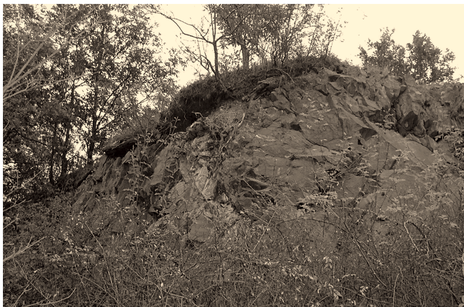
3. ábra A Vár-kúti andezit kőfejtő feltárása Figure 3. Exposure of the Vár-kút andesite quarry

A Hollókői telér a környék jellegzetes geomorfológiai nagyformájának helyi szinten legjellegzetesebb előfordulása, amely hordozza a telérek típusjegyeit (keskeny, elnyúlt alak, kőzetanyagában a mellékkőzet zárványai, peremein hőhatásra megsült mellékközetek). Bemutatására a Vártúra ösvény keretében jelenleg is sor kerül, a képződmény láthatósága szempontjából nem a legkedvezőbb helyen. Az ÉNy–DK-i csapásirányban 2,5 km hosszan húzódó telérnek csak kisebb szakasza esik a tájvédelmi körzet, illetve a Világörökség területére, így a hagyományos természetvédelmi intézkedésekkel nem biztosítható a forma integritásának megőrzése.