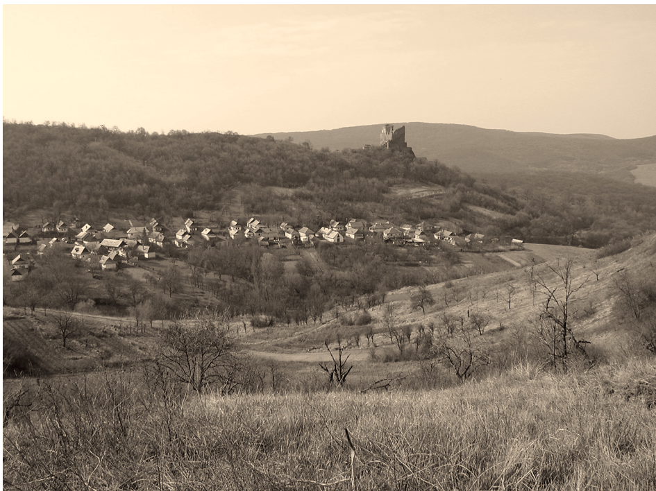
7. ábra A völgymedence látványa az Öregszőlők felől Figure 7. The view of valley basin from Öregszőlők

A tájkarakter vizsgálata, mindenek előtt az értékes, hagyományőrző és bemutatható táj-elemek értékelése, valamint a jelenlegi tájhasznosítás és a környezet állapota alapján meghatároztuk a tájgondozási és környezetrendezési szempontú kezelési övezetbeosztást. Az övezetek nem feltétlenül esnek egybe a tájvédelmi körzet természetvédelmi kezelési övezeteivel, hiszen a Világörökség kezelésénél egyrészt a különleges tájkarakter védelme, a kultúrtörténeti emlékek gondozása, fenntartása és bemutatása a meghatározó feladat. A Világörökség kezelési tevékenységnek valamint a természetvédelmi kezelés élőhely- és élővilág védelmi tevékenységének egymással összhangban kell lennie, egymást kiegészítve kell működnie.