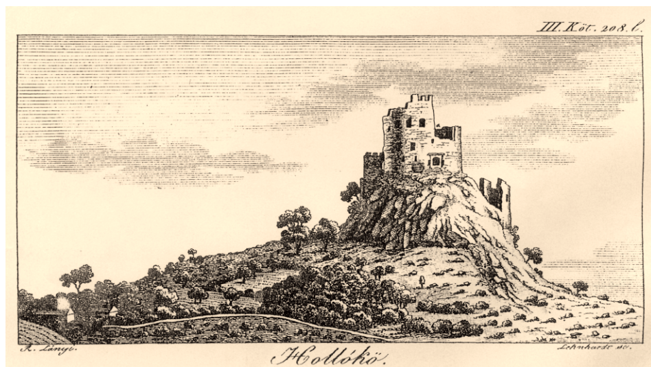
1. ábra A Várhegy és környéke 1826-ban MOCSÁRY A. könyvében Figure 1. Vár Hill and its surroundings in 1826 in the book of A. MOCSÁRY

19. század végétől épültek a „borházak”, azok azonban az 1950-es évekre nyomtalanul eltűntek.