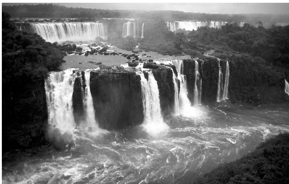
1. ábra Az Iguazu Nemzeti Park látképe a brazil oldalról Figure 1. View of the Iguazu National Park from the Brazilian side

Az ismertetett korszak első fontos eseménye volt az Iguazu Nemzeti Park megalapítása Argentínában (1934) (Brazília csak öt évvel később, 1939-ben alapított hasonló néven nemzeti parkot (1. ábra). Argentín oldalon 1909, brazil oldalon pedig 1916 óta folynak a védelemmel kapcsolatos próbálkozások. Az argentin oldalon húzódó területeket 1984-ben, míg a brazil oldalt 1986-ban vették fel a Világörökség listára.