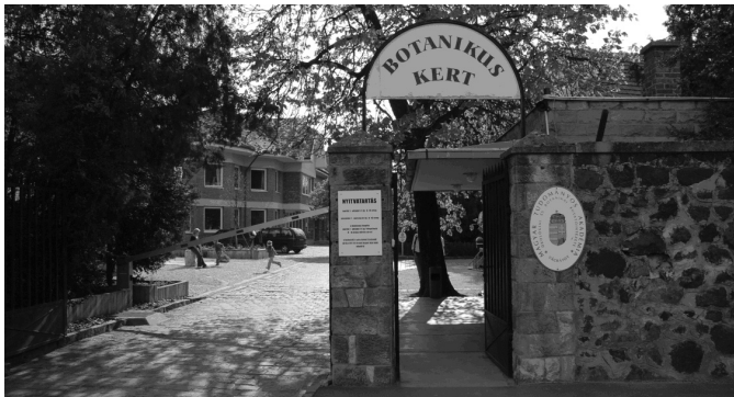
5. ábra A Vácrátóti Botanikus Kert bejárata Figure 5. Entrance of the Botanical Garden of Vácrátó

Az arborétum az 1830-as években kezdett kialakulni, erre a Rákos-patak mentén húzódó éger-szil-köris ligeterdő adta az alapötletet, létrejöttét azonban csak a világ első nemzeti parkja (Yellowstone) alapításának idejére, 1872-re teszik. Ekkor került a terület a természetszerető Vigyázó Sándor tulajdonába, aki megbízást adott egy angolpark létrehozására. A romantikus elképzelések közül sok megvalósult, a harminc év alatt kialakított romantikus kertben megépült egy gótikus álrom, több tó, egy műbarlang, egy kis vízimalom és számos mesterséges domb is.