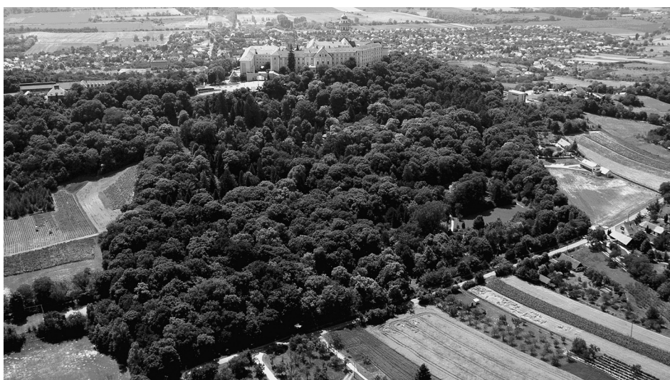
4. ábra A Pannonhalmi Arborétum Természetvédelmi Terület Figure 4. The Pannonhalmi Abbey Arboretum Nature Conservation Area

A ma is látogatható Apátsági Arborétumot (4. ábra) hivatalosan 1802-ben alapították.