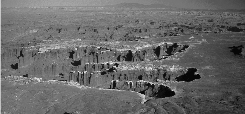
2. ábra A Canyonlands Nemzeti Park látványa Figure 2. View of the Canyonlands National Park

A Utah Államban fekvő, 136 715 hektáros nemzeti park a Colorado és a Green folyók találkozásánál fekszik (2. ábra). Az 1964. szeptember 12-én alapított park közel félmillió látogatót fogad évente.