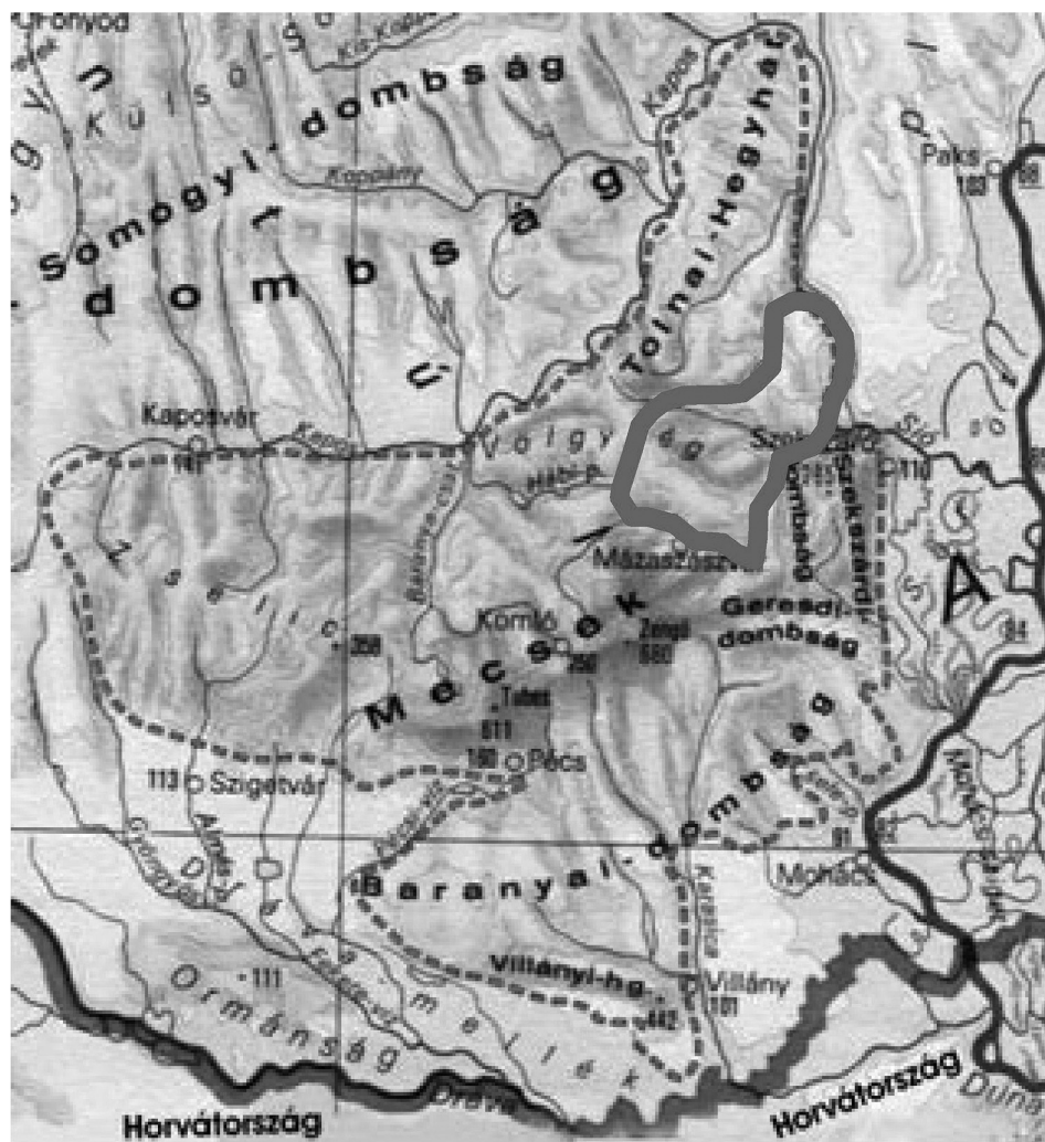
1. ábra A Völgység és a Tolnai-hegyhát elhelyezkedése és a tágan értelmezett Sopianicum flórajárás határa.

Figure 1. The geographical situation of the Völgység and Tolnai-hegyhát and the border of Sopianicum