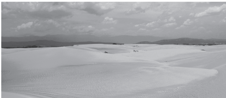
4. ábra Homokdűnék a Médanos de Coro Nemzeti Parkban, Venezuela Figure 4. Sand dunes in the Médanos de Coro National Park, Venezuela