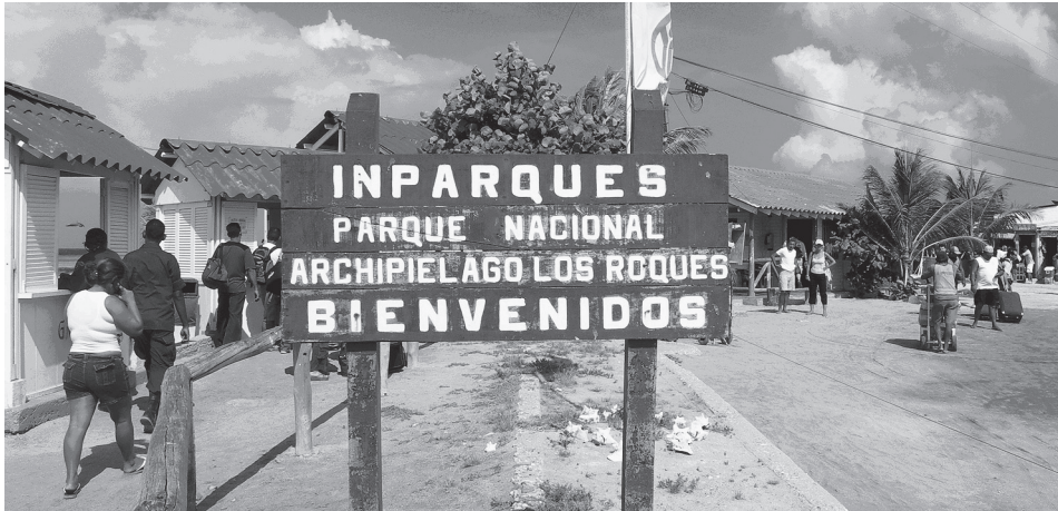
2. ábra Az Archipiélago Los Roques Nemzeti Park bejárata a repülőtér mellett

A szigetcsoport döntő részét 1972-ben nyilvánították nemzeti parkká, területe 221120 ha. A nemzeti park felirattal és a nemzeti-parki jelenléttel kizárólag Gran Roque szigetén, a repülőtérrel találkozik a hétköznapi turista (2. ábra), ugyanis egy kis bódében őrt álló két katona az útlevele ellenőrzése mellett a nemzeti-parki belépőt is beszedi.