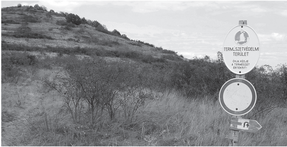
6. ábra A Gyöngyösi Sár-hegy Természetvédelmi Terület kezdetét jelző tábla Figure 6. Sign of the limit of the Gyöngyös Sár-hegy Nature Conservation Area

A terület védetté nyilvánítását a növényzeti értékeken kívül lepkefaunája is indokolta. Az állatok között számos hazai és európai viszonylatban is ritka és védett, elsősorban rovarfaj található meg. Ilyen ritkaság a hazánkban csak néhány helyen előforduló sztyeplepke ( Catopta trips ), amely sztyeprét jellegű élőhelyeken él. A másik ritkaság a nagy szikibagoly ( Gorthyna borelii lunata ), amely a száraz magaskórós sztyeprétek lakója, hernyója a zellerfélék közé tartozó orvosi vagy más néven sziki kocsord ( Peucedanum officinale ) gyökfőjében és szárában fejlődik. Ez az egyetlen tápnövényem, így sérülékenységének forrása is. A területen számos cincérfaj is képviselteti magát, az idős tölgyesekben él a nagy hőscincér ( Cerambyx cerdo ), a körises szegélyekben és gyümölcsösökben a diófocincér ( Aegosoma scabricorne ), a molyhos tölgyesekben a keskeny tölgycincér ( Stenidea genei ), míg a gurgolyafajokhoz kapcsolódik az árgusszemű cincér ( Musaria argus ), a tarka imolához pedig a selymes cserjecincér ( Cortodera holosericea ) élete kötődik.