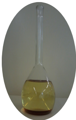
2. ábra Biodízel vizuális vizsgálata Figure 2 Visual inspection of biodiesel

Az átészterezés sikere szemrevételezéssel is megállapítható: megfigyelhető a rétegződés, melyet a 2. ábra szemléltet. A felső világosabb réteg (80–90%) a biodízel, az alsó sötétebb réteg (10–20%) a glicerín, katalizátor és alkohol keveréke, míg a középső tejfehérszerű réteg a szappan.