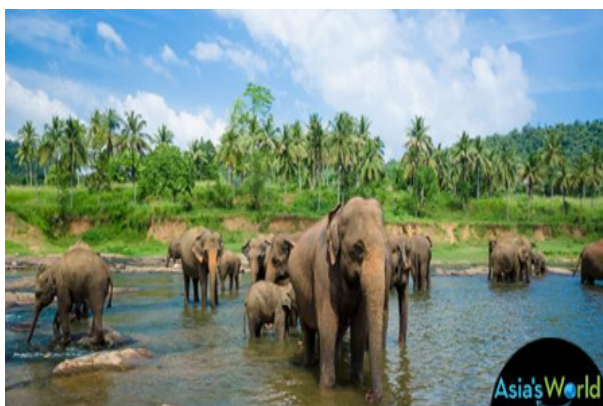
12. ábra Ceyloni elefánt csorda ( Elephas maximus maximus ) (http21). Figure 12. Sri Lankan elephant herd ( Elephas maximus maximus ) (http21).

Srí Lanka 26 endemikus madara közül, 20 esőerdei faj, melyek mind megtalálhatók ezen a helyen, köztük a vörösképű selymeskakukk, a sárgacsőrű bozótkakukk és a díszes kitta (13. ábra) (http19).