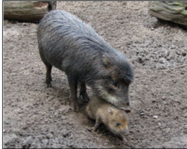
5. ábra A rezervátum területén élő veszélyeztetett fehérájú pekari ( Tayassu pecari ) (http11) Figure 5. The endangered white-lipped peccary ( Tayassu pecari ) in the area of the reserve (http11)

A rezervátumban olyan veszélyeztetett fajok is élnek, mint például a közép-amerikai tapír ( Tapirus bairdii ) és a fehérájú pekari ( Tayassu pecari ) (http11) (5. ábra).