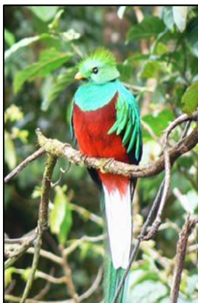
4. ábra A rezervátum területén megfigyelhető quetzal ( Pharomachrus mocinno ) (http10)

A madarászok azért kedvelik különösen ezt a rezervátumot, mert lehetőséget ad, hogy megfigyeljék a quetzalt ( Pharomachrus mocinno ) (4. ábra). A területen más figyelemre méltó madárfajok is élnek, például a feketehasú kolibri ( Eupherusa nigriventris ), a kéksapkás szajkó ( Cyanolyca cucullata ), és a csupasznakú sisakosmadár ( Cephalopterus glabricollis ) (http10).