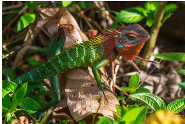
14. ábra: Nászruhás tüskeshátú agáma ( Calotes calotes ) hím (http23). Figure 14. Male green forest lizard ( Calotes calotes ) in breeding colours (http23).

A hüllők közé tartoznak a tüskeshátú agáma ( Calotes calotes ) az endemikus Srí-Lanka-i bambuszvipera és a púpos orrú vipera.