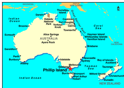
6. ábra A Phillip-sziget elhelyezkedése Ausztráliában (http12) Figure 6. Location of the Phillip Island in Australia (http12)

A „Phillip Island” egy ausztrál sziget, amely mintegy 140 km-re fekszik Melbourne dél-délkeleti részétől (6. ábra). Nevét Arthur Phillipről kapta, aki Új-Dél-Wales első kormányzója.