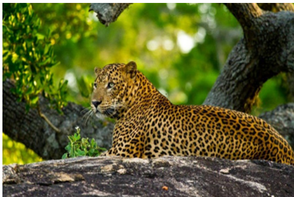
11. ábra Pihenő sri lanka-i leopárd ( Panthera pardus kotiya ) (http20). Figure 11. Resting Sri Lankan leopard ( Panthera pardus kotiya ) (http20).