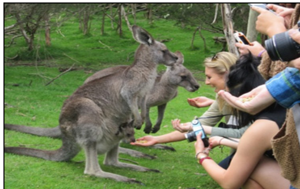
8. ábra Kengurukat etető látogatók. (http15) Figure 8. Visitors feed kangaroos (http15)

A szigeten ezen kívül található egy vadspark, ahol kenguruk kóborolnak szabadon a látogatók között, akik ha szeretnék kézből is etethetik őket (8. ábra) (http13).