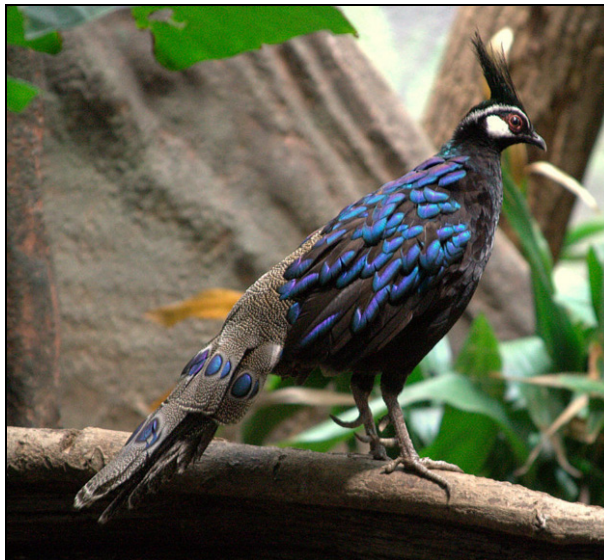
3. ábra A díszes pávafácán ( Polyplectron napoleonis ) (http9)

Figure 3. The Palawan peacock-pheasant ( Polyplectron napoleonis ) (http9)