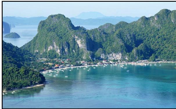
2. ábra El Nido látképe, Fülöp-Szigetek (http7)

A terület ismert a fehér homokos tengerpartjáról, a korallzátonyairól és mészkő szirtfaláról. A legjobb tengerpartnak és úticélnak tartják a Fülöp-szigeteken a kivételes természeti szépsége miatt (http7).