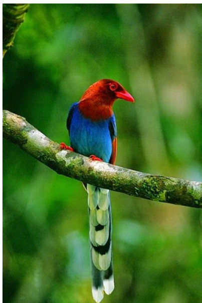
13. ábra A díszes kitta ( Urocissa ornata ) (http22). Figure 13. The Sri Lanka blue magpie ( Urocissa ornata ) (http22).

Srí Lanka 26 endemikus madara közül, 20 esőerdei faj, melyek mind megtalálhatók ezen a helyen, köztük a vörösképű selymeskakukk, a sárgacsőrű bozótkakukk és a díszes kitta (13. ábra) (http19).