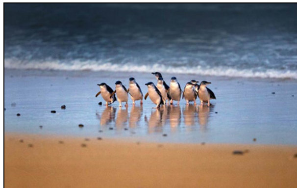
7. ábra Halászatból visszatérő kék-pingvinek ( Eudyptula minor ) (http14) Figure 7. Little penguins ( Eudyptula minor ) returning from fishing (http14)

populációkat tart el (kék pingvineket (7. ábra), bukó sirályokat és egyéb különleges madárfajokat) (http13).