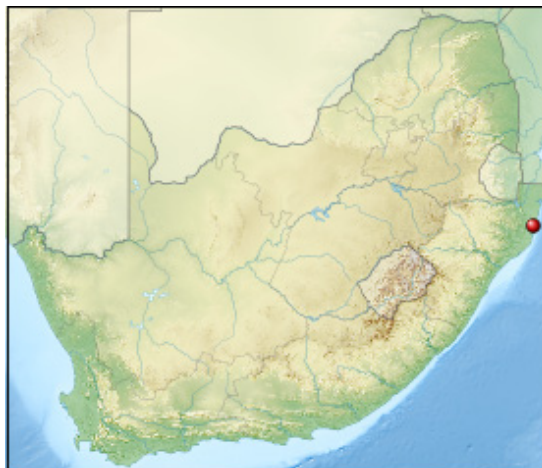
1. ábra Az iSimangaliso Wetland park elhelyezkedése Dél-Afrikában ( http4 ) Figure 1. Location of the iSimangaliso Wetland Park within South Africa ( http4 )

A iSimangaliso Wetland Park (korábbi nevén Greater St. Lucia Wetland Park) Dél-Afrika harmadik legnagyobb védett területe (1. ábra). A park teljes területe 332.000 hektár ( http4 ).