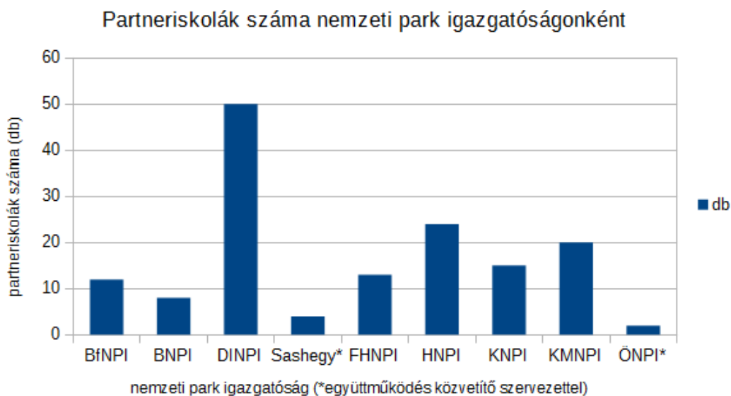
1. ábra. Partneriskolák száma nemzeti park-igazgatóságoként Figure 1. Number of partner schools per national park directorate

Összességében tehát elmondható, hogy a nemzeti park-igazgatóságokon IKSZ-ot végző diákok minden esetben kötődnek valamilyen szempontból a területhez.