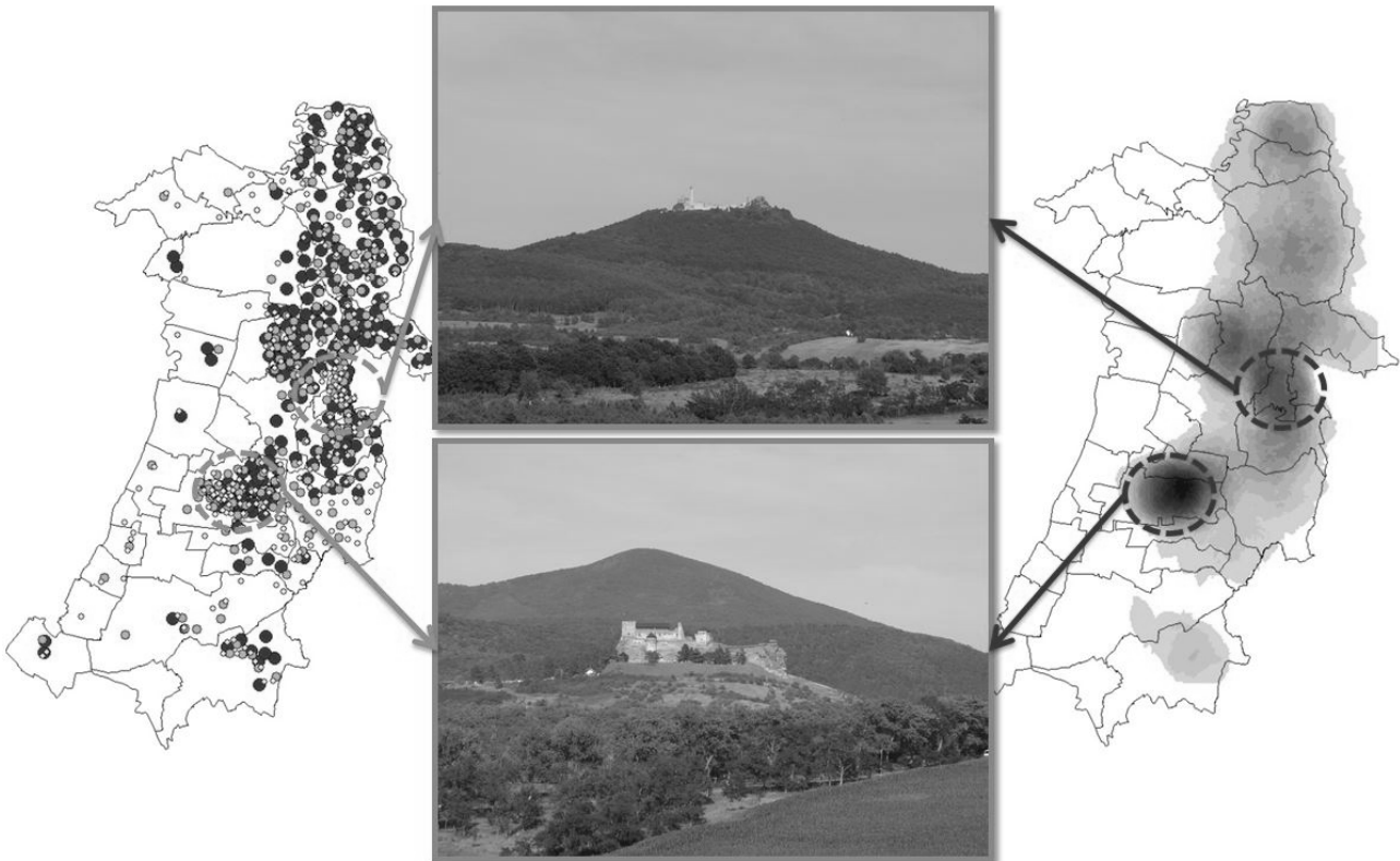
3. ábra A két sűrűsödési helyen lévő jellegzetes tájelemek: a Regéci várrom (fent) és a Boldogkői vár (lent)

területein a tervezés, stratégiaalkotás során szükséges a helyiek bevonása a meghatározó elemek detektálásához.