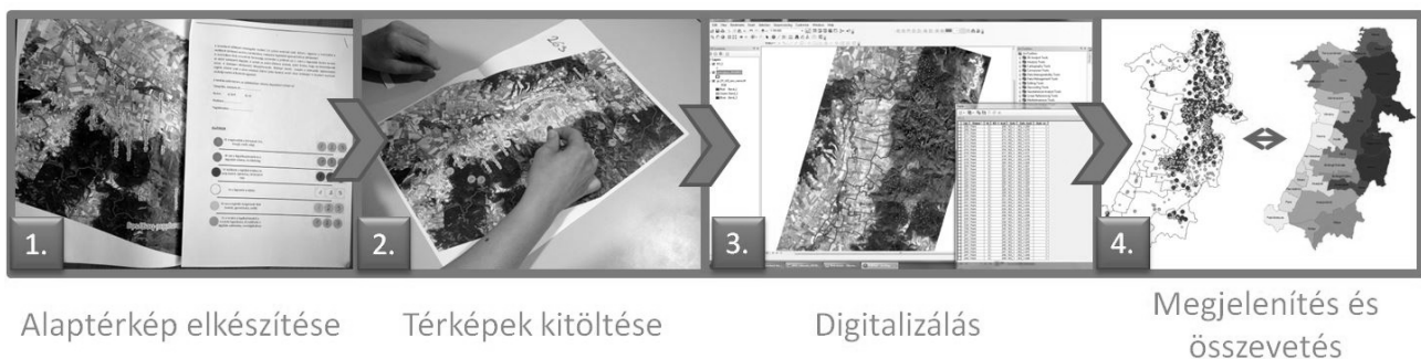
1. ábra A ppGIS folyamata Figure 1. Process of the ppGIS evaluation

A felmérést követően az eredménytérképeken lévő összes pontot digitalizáltuk ArcGIS program segítségével. Megkülönböztettük az egyes szempontokat, valamint a szempontokon belüli sorrendet is. Összevettük az így létrejött ponttérképet a saját, településhatáros értékeléseinkkel. Külön vizsgáltuk minden kategória esetében az 1-es számú pontok helyét (a legfontosabbnak ítélt területeket). A könnyebb összehasonlíthatóság, valamint a többféle megjelenítés miatt pontsűrűség térképet/„hő térképet” is készítettünk, így az egymáshoz nagyon közel lévő, esetleg egymást eltakaró pontok érzékelhetőbbé váltak. A „hő térkép” összeállítása során az 1-es, 2-es, 3-as kategóriákba tartozó pontokat fontosságuk alapján különböző súllyal kalkuláltuk. A feldolgozás menete az 1. ábrán szematikusan látható.