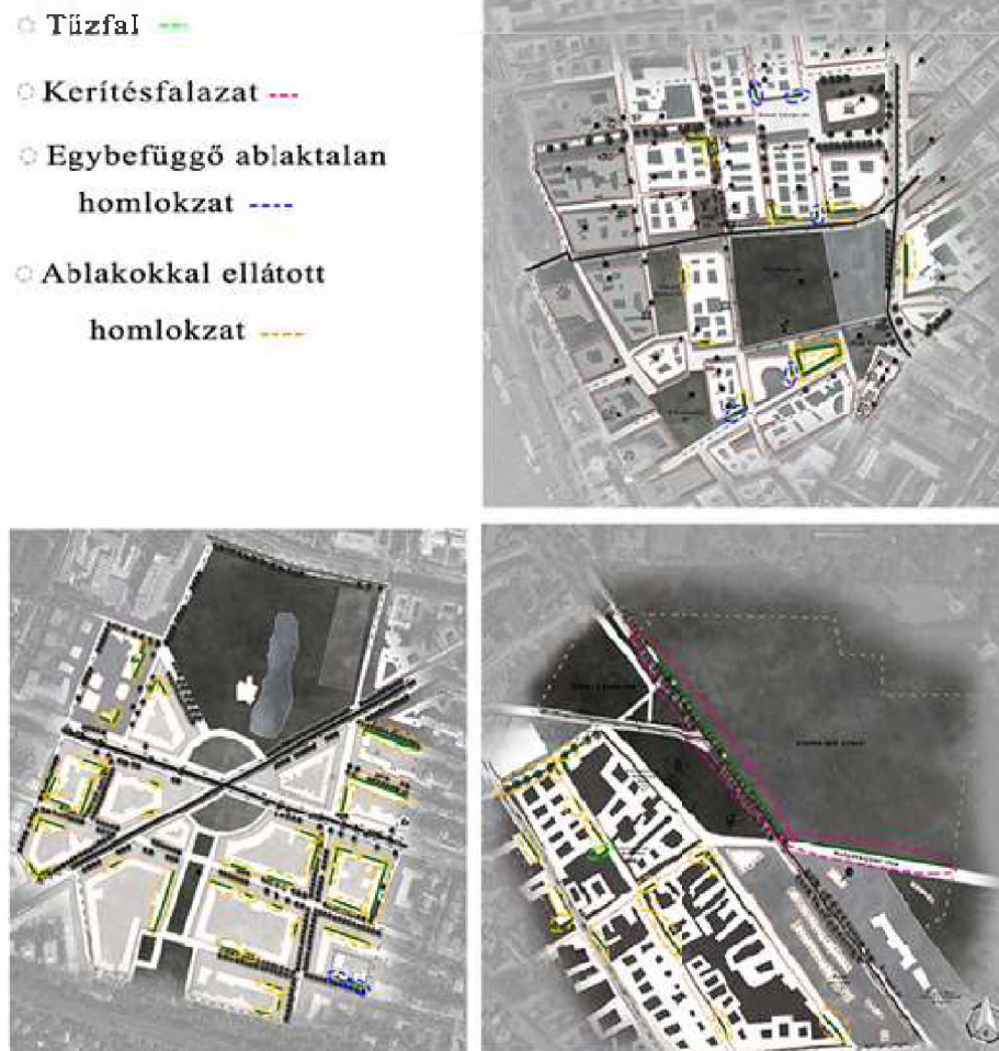
2. ábra Alkalmos homlokzatok elhelyezkedése és falfelület jellegük

tér kutatási területén 28 db nyílásos homlokzat van, amelyek összfelülete 1533,2 m 2 -t tesz ki. A Kosztolányi Dezső téren ezek az értékek majdnem 2,5-szer nagyobbak: 67 db, összesen 4354,8 m 2 -nyi ilyen típusú homlokzat van. Ezen típusú homlokzatoknak a nyílászárók (elsődlegesen ablakok) miatt kisebb vizuális hatásuk lenne zöldhomlokzat telepítése esetén, mint az összefüggő felületet alkotó tűzfalnak, kerítés-falazatoknak és egyéb egybefüggő ablak nélküli homlokzatoknak (3. ábra).