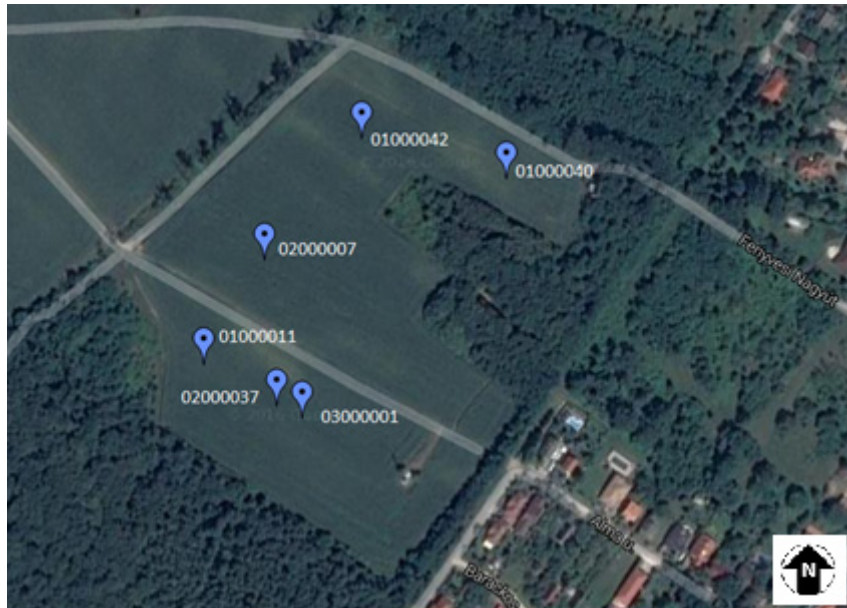
1. ábra A gödöllői mintaterületen elhelyezett talajszondák elhelyezkedése, a gyári számaikkal együtt (Forrás: Google Maps)

Figure 1. Location of probes in Gödöllő sampling area, with its serial numbers (Source: Google Maps)