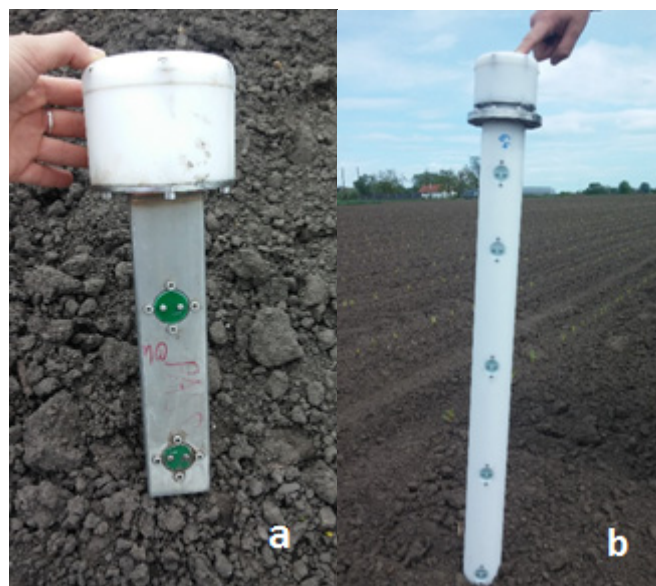
2. ábra: Egy téli szonda (a) és egy nyári szonda (b) képe

A talajszondák 2 kivitelben készültek. A téli szonda (rövid szonda) 2 mélységben (8 cm, 20 cm) méri a talajhőmérsékletet és talajnedvesség-tartalmat (2. ábra).