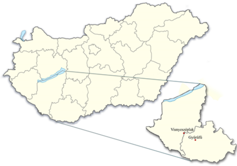
1. ábra Visnyeszéplak és Gyűrűfű elhelyezkedése (készítette Hága Krisztián) Figure 1. Location of Visnyeszéplak and Gyűrűfű (by Krisztián Hága)