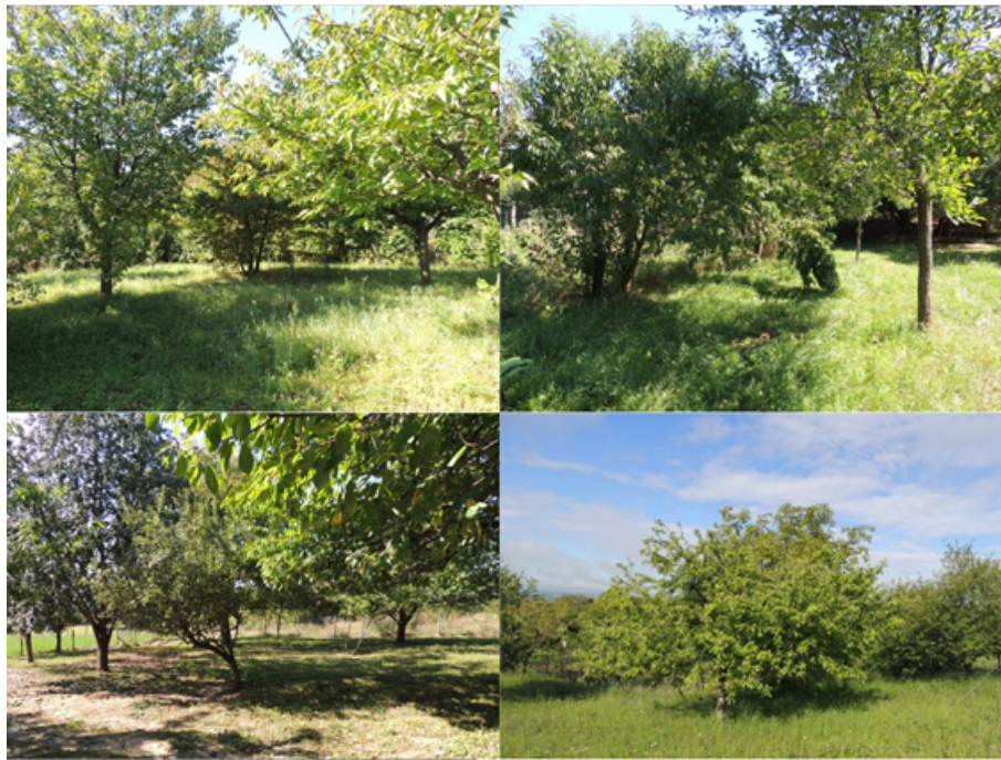
5. ábra Visnyeszéplak gyümölcsösei Figure 5. Orchards of Visnyeszéplak

Gyűrűfűn általában a gyümölcsfák szervesen a kert részét képezik, a ház körül található belőlük néhány. Ezen a településen egy tulajdonosnak van két nagyobb, ökológiai minősítésű gyümölcsöse, amelyből egyik homogén diós, a másik pedig vegyes ültetvény (300 mandulafa, 600 vegyes – szilvafa, kajsziarackfa és meggyfa – és 1000 körtefa, melyekből 300 nashi (japán) körtefa és 700 európai körtefa) (6. ábra). Ezek összességében 8,08 hektárosak és ezzel a gyűrűfűi összterület csupán 2%-át teszik ki. A két parcellát alapvetően szárazúzással kezeli a tulajdonos.