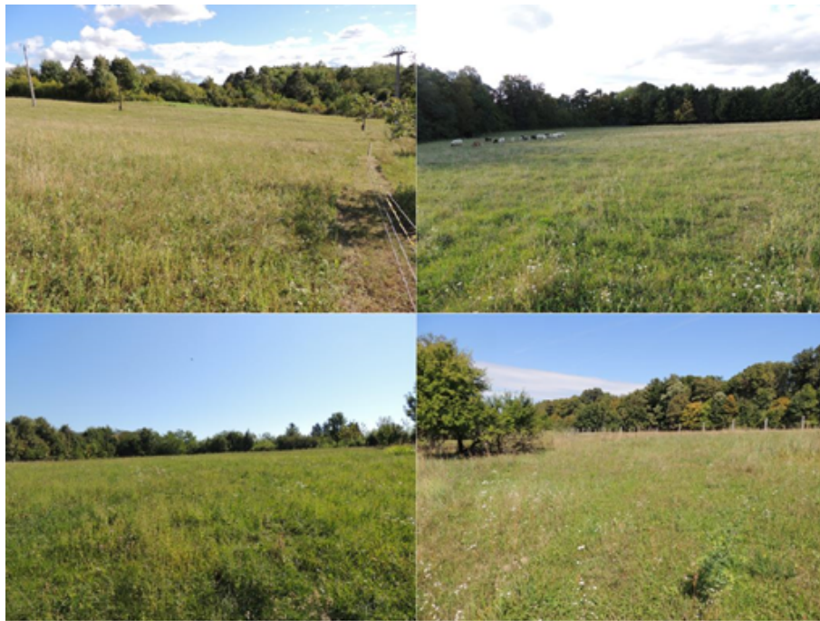
3. ábra Visnyezéplaki gyepterületek (készítette Prohászka Viola) Figure 3. Meadows of Visnyezéplak (by Viola Prohászka)

Az ökoszisztéma állapot elemzésének harmadik és egyben utolsó csoportja a közvetett hatások csoportja, amely a gazdálkodást, a területhasználat intenzitását és a helybeli lakosság életmódját foglalja magába. Fontos kijelenteni, hogy mindkét ökofalu fontosnak tartja a vegyszermentességet, nem csak a gazdálkodásban, de a háztartásban is, így ott is igyekeznek környezetbarát megoldásokat használni. Az élőhelyek kezelésében szintén vannak hasonlóságok, de különbségek is a két településen. A gyepterületeket tekintve mindkét területen fontosnak tartják a helybeliek az élőhely optimális kezelését. Így vegyesen és sokszor felváltva használják, kaszálják és legeltetik, valamint legeltetés közben fokozottan figyelnek arra, hogy (részben) az erózió megakadályozása érdekében a területek ne legyenek túllegeltetve még akkor sem, ha több állat van. Általában szarvasmarhákkal, lovakkal, kecskékkal és juhokkal legeltetnek, főleg szakaszosan. Kaszálni nagyrészt géppel kaszálnak, de a széplakiaknál előfordul még, hogy valaki a kisebb gyepterületet kézzel kaszálja. Összességében a folyamatos természetközeli kezelés mindkét településnél pozitív hatást gyakorol erre az élőhelyre (3–4. ábra).