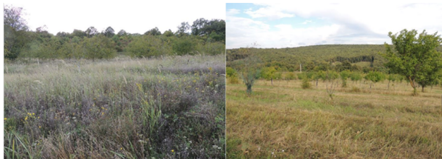
6. ábra Gyűrűfű két gyümölcsöse (balra: diós; jobbra: vegyes) (készítette Prohászka Viola) Figure 6. Orchards of Gyűrűfű (left: walnut orchard; right: mixed orchard) (by Viola Prohászka)

Gyűrűfűn általában a gyümölcsfák szervesen a kert részét képezik, a ház körül található belőlük néhány. Ezen a településen egy tulajdonosnak van két nagyobb, ökológiai minősítésű gyümölcsöse, amelyből egyik homogén diós, a másik pedig vegyes ültetvény (300 mandulafa, 600 vegyes – szilvafa, kajsziarackfa és meggyfa – és 1000 körtefa, melyekből 300 nashi (japán) körtefa és 700 európai körtefa) (6. ábra). Ezek összességében 8,08 hektárosak és ezzel a gyűrűfűi összterület csupán 2%-át teszik ki. A két parcellát alapvetően szárazúzással kezeli a tulajdonos.