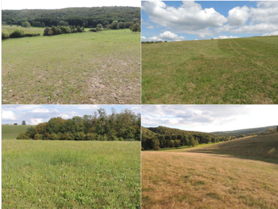
4. ábra Gyűrűfűi gyepterületek (készítette Prohászka Viola) Figure 4. Meadows of Gyűrűfű (by Viola Prohászka)