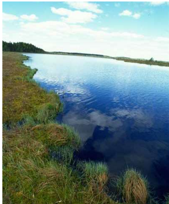
2. ábra A Darwin Zapovednik jellemző tájképe (http20) Figure 2. The typical landscape of Darvinsky Zapovednik (http20)

A zapovednik jelentős része vizes élőhely (2. ábra). A melegebb, sekély vizekben jelen vannak sásfélék, hínáros békaszőlő ( Potamogeton perfoliatus ), bodros ( P. natans ) és üveglevelű békaszőlő ( P. lucens ). Fennmaradt néhány úszóláp a víztározó elárasztása után, benne hüvelyes gyapjúsással ( Eriophorum vaginatum ), közönséges náddal ( Phragmites australis ) és széleslevelű gyékénnyel ( Typha latifolia ). Különlegesség, hogy néhány úszólápon megtelepedett a molyhos nyír ( Betula pubescens ) és egyes fűzfajok is (http19). A Darwin Zapovednik értékes élőhelyei a láp- és mocsárerdők, illetve a lápok és mocsarak. Ezeket az ökoszisztémákat időszakosan elönti a víz a csapadékmennyiségtől és a vízerőművek vízszükségletétől függően. Száraz időszakokban a füves élőhelyek, az esős periódusokban azonban a nedvességkedvelő növények kerülnek túlsúlyba (http19). A fellápokon az erdei fenyő ( Pinus sylvestris ) uralja a tájat. A legmagasabb térszíneken a fenyvesek veszik át a szerepet, ahol a lucfenyő ( Picea abies ) a domináns faj. Ehhez a társuláshoz hozzátartozik a fekete áfonya ( Vaccinium myrtillus ) és a közönséges boróka ( Juniperus communis ). A Darwin Zapovednik legritkább növényfajai közé tartozik a Boldogasszony papucs ( Cypripedium calceolus ) és a levéltelen bajuszvirág ( Epipogium aphyllum ) (http19). Feltehetőleg mindezen természeti értékek miatt tartozik a tárgyalt zapovednik az IUCN Ia kategóriájába (http18).