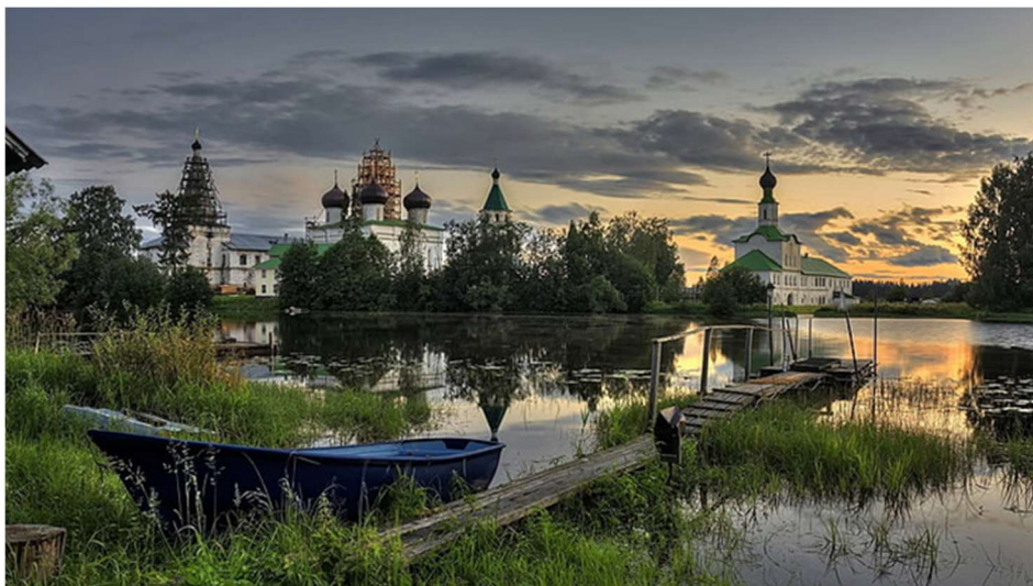
6. ábra Az Antonievo-Szijszki kolostor és környezete (http29) Figure 6. The Antonievo-Siysky monastery and its surroundings (http29)

Területe domborzatilag síkságnak nevezhető, amelyen karsztformációk és karszttavak is megfigyelhetők. A zakaznik az Északi-Dvina folyó bal partján fekszik, északi területrészt ez a folyó határolja, míg déli területrésze a Jemca folyóval határos, amely az Északi-Dvina egyik legnagyobb mellékfolyója. Déli területrészt átszeli a Jemca folyó egyik mellékfolyója, a Vajmuga folyó. A zakaznik északi részén számos tó található, a legnagyobbak közé a Ploszkoje-tó és a Punanecs-tó tartozik. Összesen 52 tó és 16 mocsár található a védett területen.