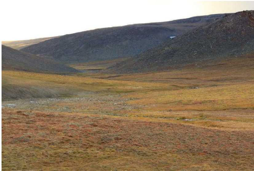
4. ábra A Wrangel-sziget uralkodó vegetációja, a tundra növényzet (http24) Figure 4. The main vegetation of Wrangel Island is the tundra (http24)

A zapovednik nagyobb részén tundravegetáció található, de a melegebb déli és középső vidéken sztyeppjellegű élőhelyek is előfordulnak (4. ábra). A terület magas természetvédelmi értékét az is mutatja, hogy jelenlegi tudásunk szerint 417 edényes növényfaj vagy alfaj él a szigeten, több mint a kanadai szigetvilágban összesen. Ebből 25 faj endemikus (http25). Különleges növényei közé tartozik a Dryas punctata nevű rózsaféle, ezen kívül ritkaság még az Észak-Amerikából származó Castilleja elegans nevű vajvirágféle, továbbá 17 sarkvidéki mákféle is előfordul itt, mint például a Papaver gorodkovii . A folyóvölgyekben különösen gazdag a sziget élővilága. Az itt élő fajok közül említésre méltó a Potentilla wrangelii nevű endemikus pimpó, amely a sziget nevét viseli (http24).