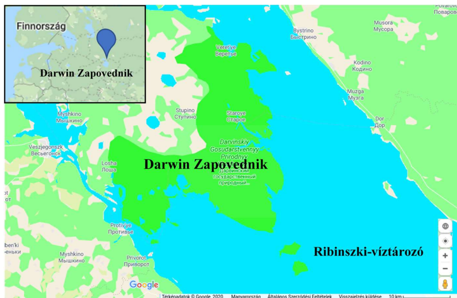
1. ábra A Darwin Zapovednik elhelyezkedése Figure 1. The situation of the Darvinsky Zapovednik

Az 1945-ben alapított Darwin Zapovednik, amely Charles Darwin után kapta a nevét, 1 127 négyzetkilométeren fekszik Oroszország nyugati részén (1. ábra), Moszkvától északra (http17). 2002-ben bioszféra rezervátummá nyilvánították (Brynskikh et al. 2015). A terület Oroszország harmadik legnagyobb ember által kialakított állóvízének, a Ribinszki-víztározónak a partján található, a Jaroslavi és a Vologodi régiók határán. A tározót a Sekszna és a Mologa folyók táplálják. A védett természeti területre nézve a legnagyobb veszélyt a tőle 30 km távolságra fekvő Cserepovec városa jelenti. Ez egy körülbelül 300 000 lélekszámú ipari központ, amely nagy mennyiségű szennyezőanyagot enged a folyóba, és ezzel a Ribinszki-víztározóba (http19).