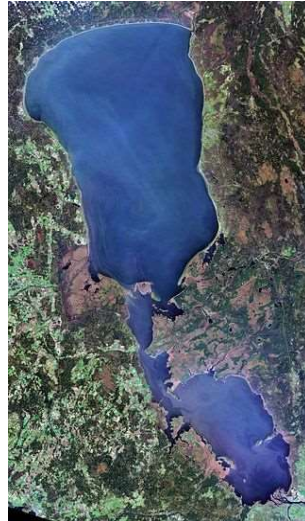
5. ábra A Csúd-Pszkovi-tórendszer műholdas képe (http27) Figure 5. The satellite view of Lake Peipus (http27)