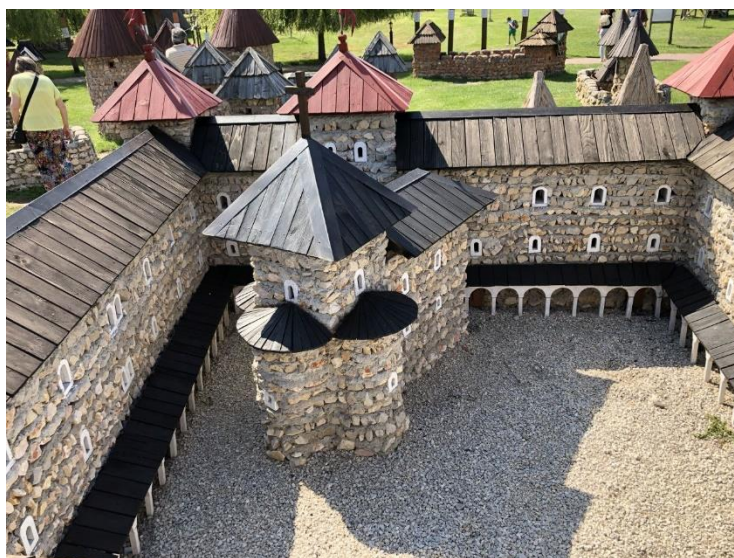
1. kép: A Székesfehérvári vár valóság-hű makettje a Dinnyési várparkban

A vármakettek építésekor a régészeti alaprajz jelentette a kiindulási pontot, illetve a régészeti ásatások során szerzett információk. Mindezek alapján Alekszi Zoltán vázlatrajzok elkészítésével kezdte munkáját, a vármakettek építése pedig az eredeti alapanyagokból történt. A makettek megjelenése természetesen az alkotó egyéni stílusát is tükrözik. A legautentikusabb vármakett a székesfehérvári vár miniatűr mása. (1. kép)