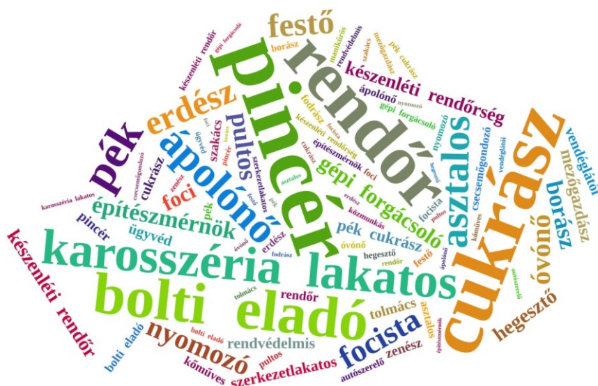
2. ábra: A vágyott szakmák/foglalkozások

A kérdőíves felmérés során vizsgáltam, hogy a megkérdezett tanulók felnőtt korukban mik szeretnének lenni, kérve őket, hogy szakmát/foglalkozást írjanak (2. ábra). A 104 válaszadó közül 94 fő válaszolt e kérdésre, összesen 121 említést tettek, amelyekben 35 szakma/foglalkozás szerepelt. (Illetve volt néhány egyéb említés, pl. közmunkás, politikus).