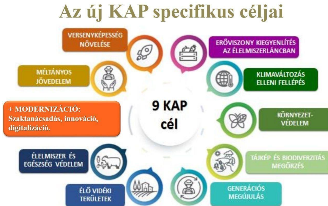
1. ábra: Az új Közös Agrárpolitika specifikus céljai Magyarországon

2027-es időszakban lesz alkalmazandó és 2023-ban lép hatályba, melynek célterületei az 1. ábrán láthatóak részletesen.