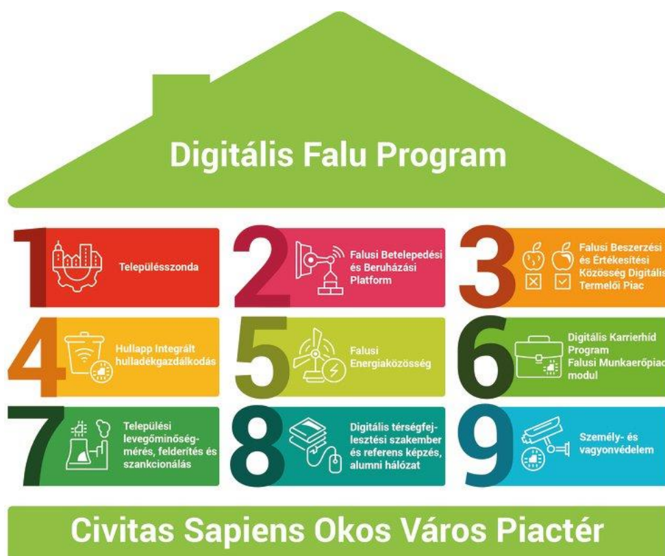
2. ábra: A Digitális Falu Program pillérei