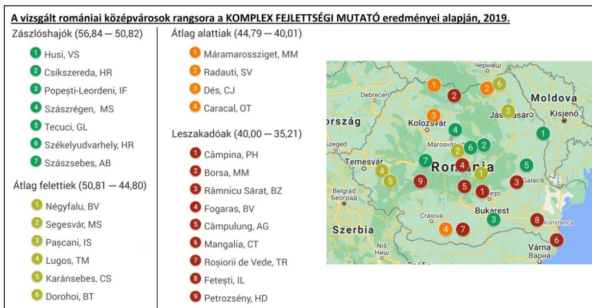
3. ábra: A vizsgált romániai középvárosok rangsora a Komplex Fejlettségi Mutató alapján, 2015-ben