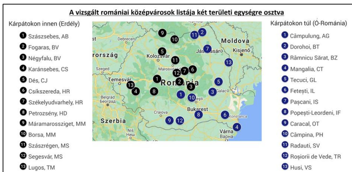
1. ábra: A vizsgált romániai középvárosok listája, két területi egységre osztva - a Kárpátok hegyvonulata által

A kutatás módszertani ismertetésének elején a vizsgálandó városok kiválasztási módszerét részletezzük. Leszögezendő, hogy az elemzés szempontjából fontos tényezőként jelentek meg Románia természetföldrajzi adottságai (jelen esetben a Kárpátok hegyvonulatai), így létrehozva – Magyarországról tekintve – a Kárpátokon innen (történelmi magyar vidék, jelenkori értelemben vett Erdély), illetve a Kárpátokon túl (ó-romániai vidék) elhelyezkedő középvárosi csoportokat. A vizsgálat alá eső városkategóriát a települési lakónépességek szerint határoztuk meg, miszerint a 28 és 48 ezer lakosságszám közötti városok képezték az elemzés alapját. E kategóriába – Románia tekintetében – mindösszesen 35 település tartozik, mindkét vizsgálati évben, ugyanakkor a statisztikai vizsgálatokhoz csökkentettük ezen elemszámot, így 13-13 db várost vontunk be a Kárpátok két „oldaláról” a vizsgálatunkba. E módszertani döntést a földrajzi-területi sűrűség csökkentésével, valamint az elemzés szempontjából kedvezőbb területi eloszlással tudjuk magyarázni. Ugyanakkor meg kell megemlíteni, hogy a nevezett téregységek településeit teljes komplexitásában is szükséges lesz megvizsgálni a jövőben, ezzel is elősegítve a romániai kis-középvárosok fejlődését. Az 1. ábra az elemzésbe bevont településeket tartalmazza: