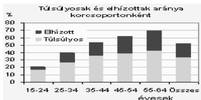
1. ábra Túlsúlyosak és elhízottak aránya korcsoportonként (Rate of overweight people by age-groups)

A túlsúlyosak és elhízottak korcsoportonkénti aránya már Magyarországon is aggodalomra ad okot (1. ábra). Már a középkorosztályban is a magyar lakosság több mint fele túlsúlyos, illetve elhízott.