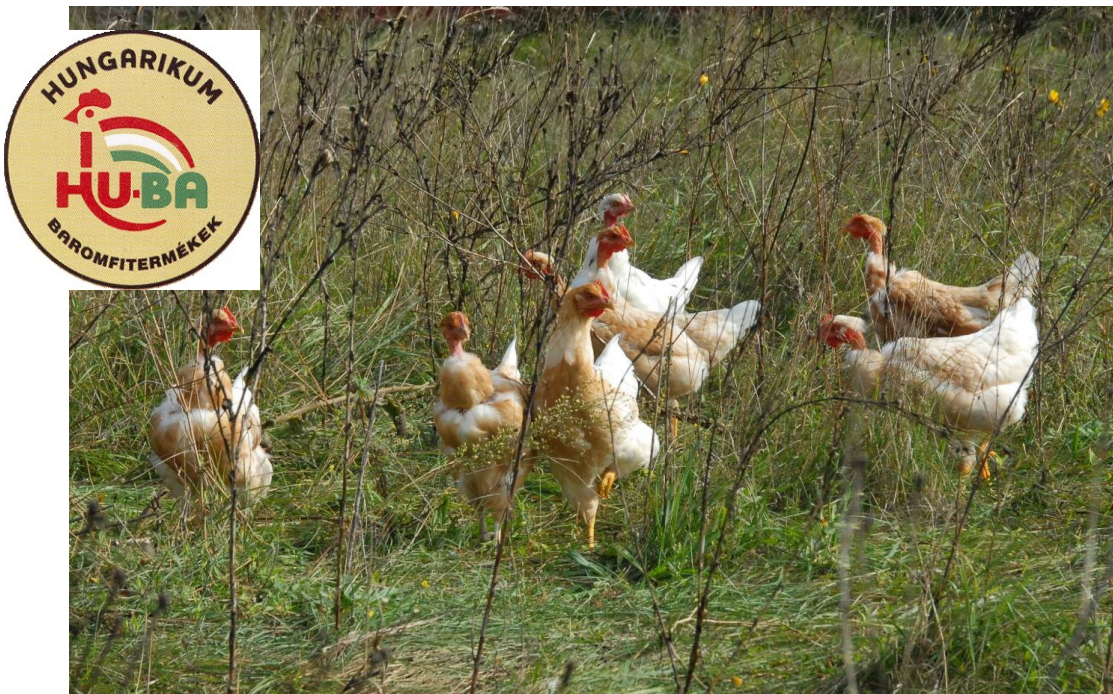
Picture 7: HU-BA (Hungaricum poultry): chickens kept free range from cross of White Transylvanian cockerel x Partridge coloured Hungarian hen, and the HU-BA trade mark registered for old Hungarian poultry products (Hungarian Poultry Gene Bank, HÁGK, Gödöllő. Photo: Kisné, Do thi Dong Xuan)

7. kép: HU-BA (Hungarikum baromfi): fehér erdélyi kopasznyakú kakas x fogolyszínű magyar tyúk keresztezéséből származó növendék csirkék szabadtartásban, és a régi magyar baromfifélék termékeinek forgalmazására bejegyzett HU-BA védjegy (Magyar Baromfi Génbank, HÁGK, Gödöllő. Fotó: Kisné, Do thi Dong Xuan)