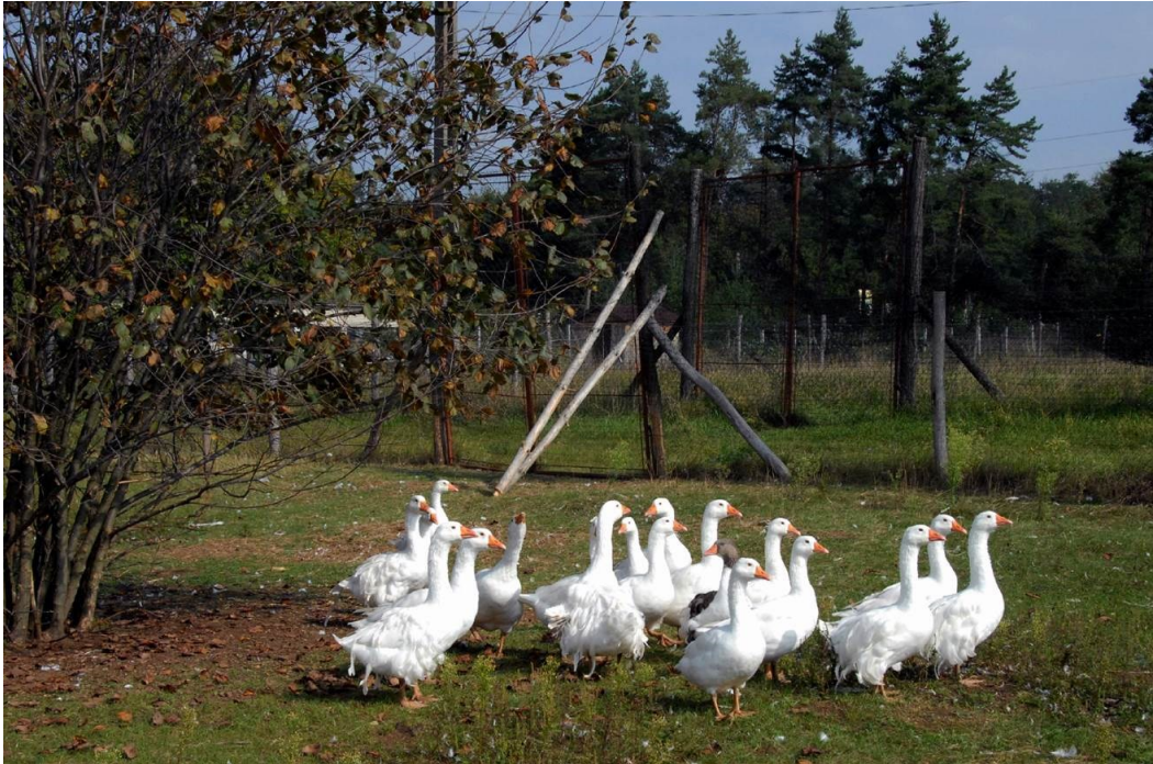
Picture 8: Geese on pasture: Hungarian goose breed varieties (Hungarian Poultry Gene Bank, HÁGK, Gödöllő. Photo: Kisné, Do thi Dong Xuan)

A fogyasztói minőséget az ízletesség is befolyásolja, de ezt számszerűsíteni nehéz. Funkcionális tulajdonságok esetében a víztartó és emulzifikáló képesség a legfontosabb befolyásoló tényező (Mézes, 2004):