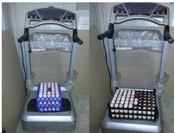
Picture 1: Handling setting on a CFM machine with different types of egg trays

1. kísérlet: a mechanikai hatásnak kitett tojások papír illetve műanyag tálcákon, 10 percen keresztül, 10-20 Hz közötti, periodikusan változó vibrációban részesültek.