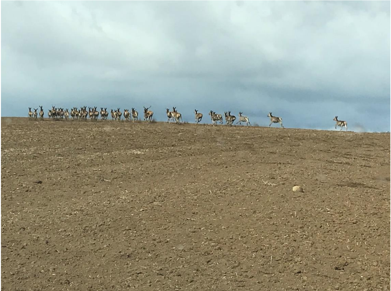
Figure 2. Estimation of game damage of red deer (district of Pásztó, Spring 2019)

Az elvégzett szakértői tevékenység nem járványvédelmi eljárás keretében történt annak ellenére, hogy szigorúan korlátozott területen belül, illetve annak közvetlen szomszédságában de a fertőztött területen került rá sor. A felmérés során tapasztalt károsítás kizárólag gímszarvastól származott (3. ábra ).