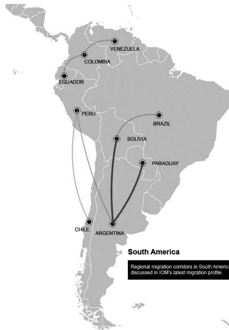
1. ábra: A dél-amerikai migrációs mozgás fő irányai

A fő migrációs folyosók Paraguay-Argentína, Bolívia-Argentína, Peru-Chile, Kolumbia-Venezuela, Kolumbia-Ecuador és Bolívia-Brazília között alakultak ki, és a migráció elsősorban gazdasági természetű munkaerő vándorlást jelentett. Kolumbia esetében félévszázados gerillamozgalmak miatt az elhúzódó polgárháborús viszonyok menekült hullámokat indítottak el, amit csak Alvaro Uribe elnöksége (2003–2010) állított meg.