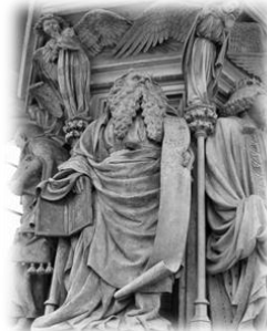
Claus Sluter: Mózes kútja Dijonban