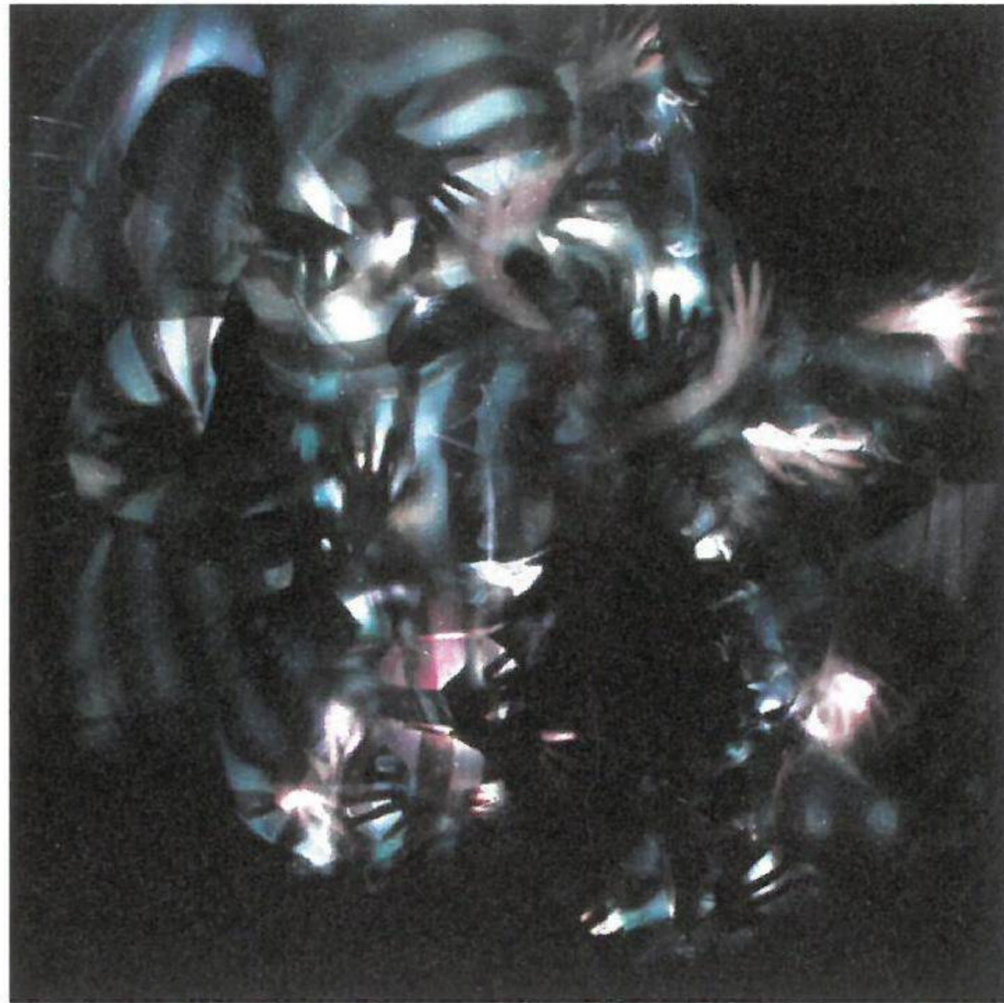
3. Horváth Erzsébet: Augmentáció, Digitális C-print, 2009