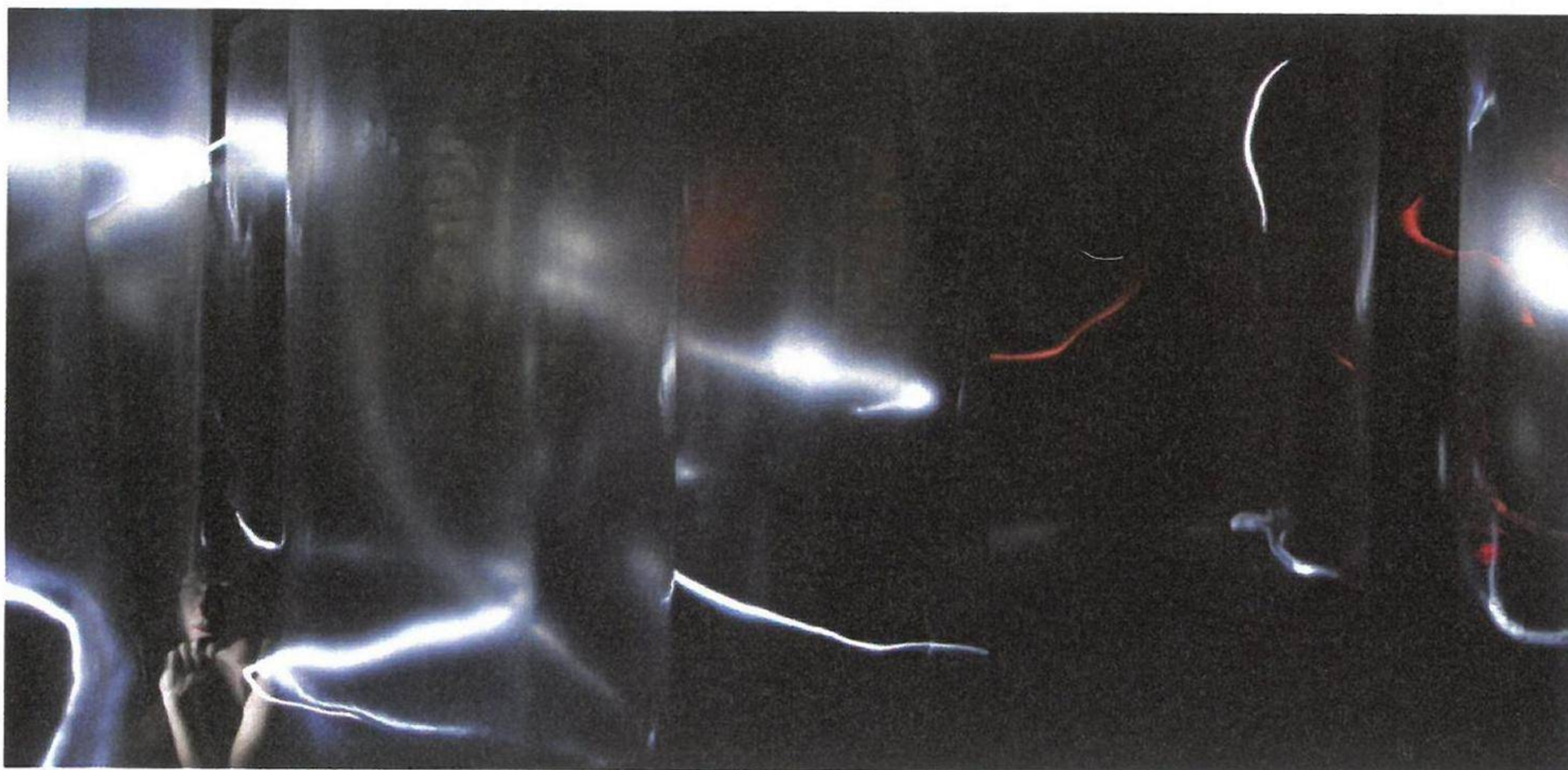
1. Horváth Erzsébet: Fényírás, Digitális C-print, 21 x 121 cm, részlet, 2007

Lengyel András–Tolvaly Ernő (2002): Kortárs képzőművészeti szöveggyűjtemény II. Bp.: A & E '93 Kiadó, 42. oldal