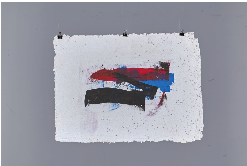
Grunner Fanni (Képi ábrázolás BA): Formátlanlág (papírpép, tempera)