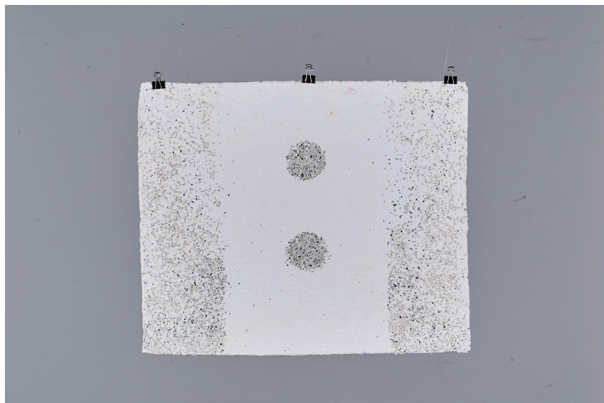
Grunner Fanni: Kiegyensúlyozottság (papírpép)