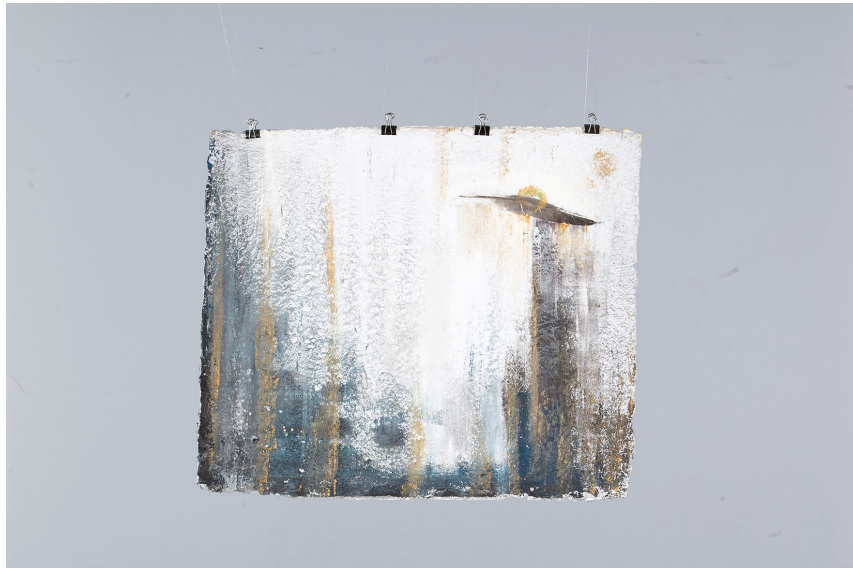
Pintér Livia (Képi ábrázolás BA): Cím nélkül (papírpép, akril)