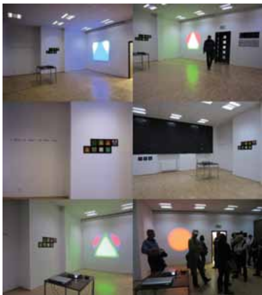
3. Fotók a kiállításról. Gyenes Zsolt: „Szinkronia '12”, SMOK, Slubice, Lengyelország, IAbiRynT, Festival Nowej Sztuki / Festival der neuen Kunst, Slubice-Frankfurt (Oder), 2012. október

Alexander László is írt a forma és szín, illetve a hang kapcsolatáról. A Bauhausban az alapformák a főszínekhez rendelődtek: a kör kék, a négyzet vörös és a háromszög sárga kitöltést kapott. 8 Ingo Glass német képzőművész „felrúgta” ezt a kánont és megcserélte a kör és négyzet színét (1989). Egész művészete erre a három szín-formára épül, hitelesen üzenve egy „kozmosz” nyelven a kor emberének. 9