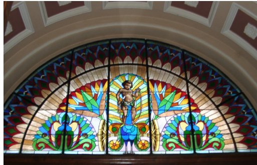
11. Ólombetűstes festettüveg bevilágító