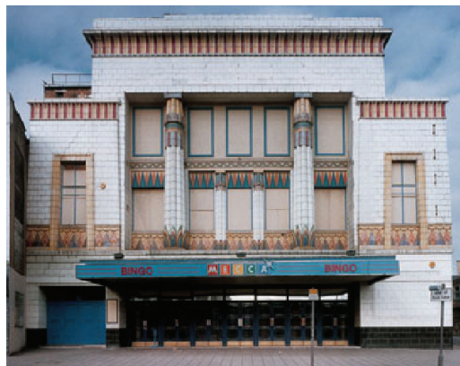
8. Carlton Cinema, London, 1930