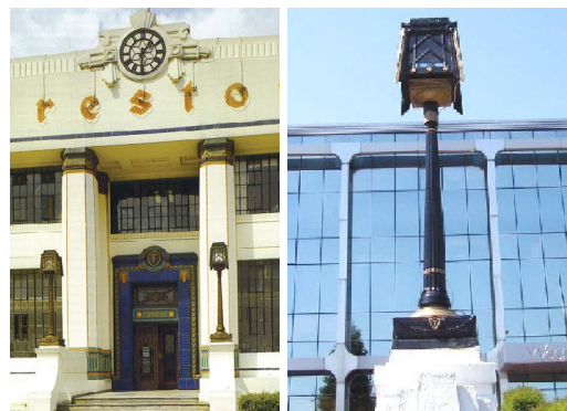
3. Firestone Factory régen és ma