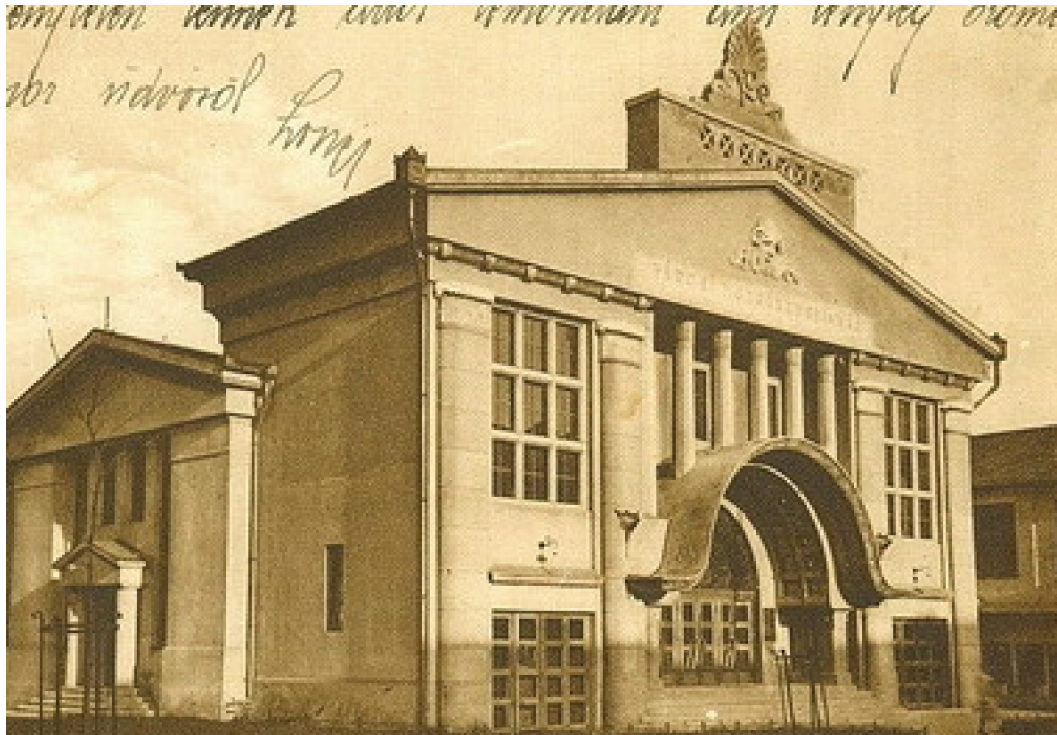
1. A kaposvári mozi régi képeslapon

ós épületek közé, majd az ezt követő irodalmak innét veszik át ezt a besorolást változatlanul. De vajon miért szecessziós egy 1928-ban épült épület? Tényleg szecessziós vagy friss szemmel, távolabbról szemlélve máshová kellene sorolni?