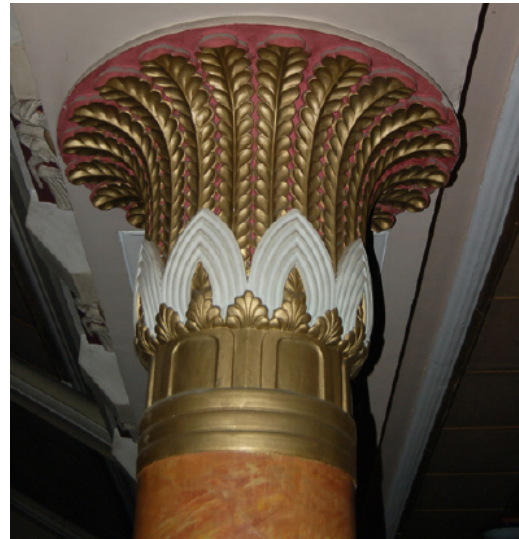
15. Pálmafejezetes oszlop