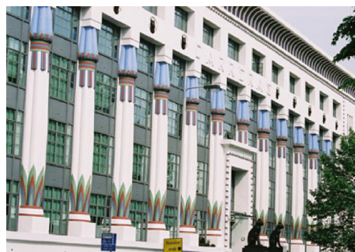
3. Carreras Cigarette Factory