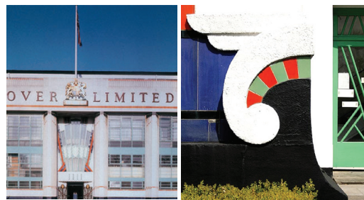
2. Hoover Building, London, 1932

A régészek megtalálták Basztet, a macskafejű istennő templomát. Ez ihlette a Carreras Cigarette Factory tervezőit, Collinst és Porrit is, mivel Carreras vállalat logoja a fekete macska