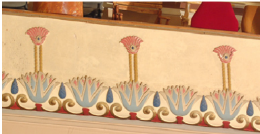
13. Karzat mellvédje

A külföldi és az hazai példákat áttekintve elmondhatjuk, hogy a kaposvári Szivárvány mozi egy értékes, szép art deco épület, amely saját stílusjegyekkel, de egyidőben épült a többi amerikai, angolai hasonló stílusú épületekkel. Az adott kor építészetét hűen tükrözi, a világ bármelyik városa büszke lehetne egy ilyen mozgóképszínházra.