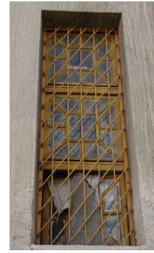
10. Megmaradt eredeti ablakosztás