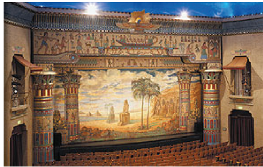
6. deKalbi Egyptian Theatre