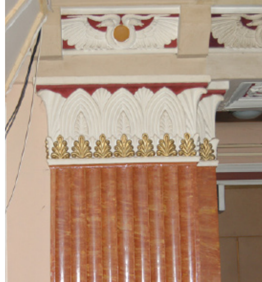
14. Pálmafejezetes pillér