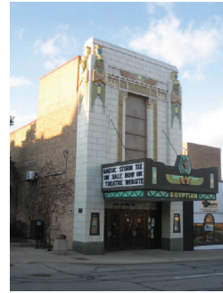
7. deKalbi Egyptian Theatre