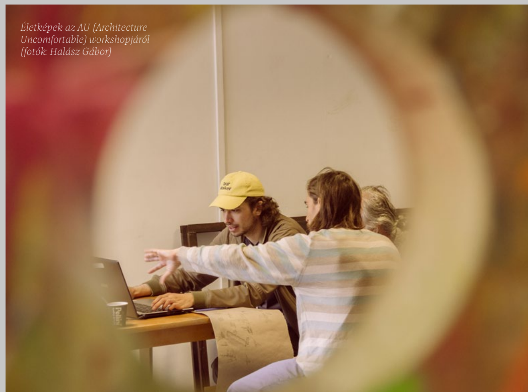
Életképek az AU (Architecture Uncomfortable) workshopjáról