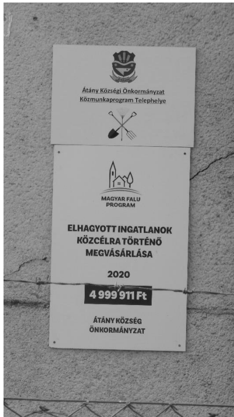
2. kép: Innovatív forrásfelhasználás