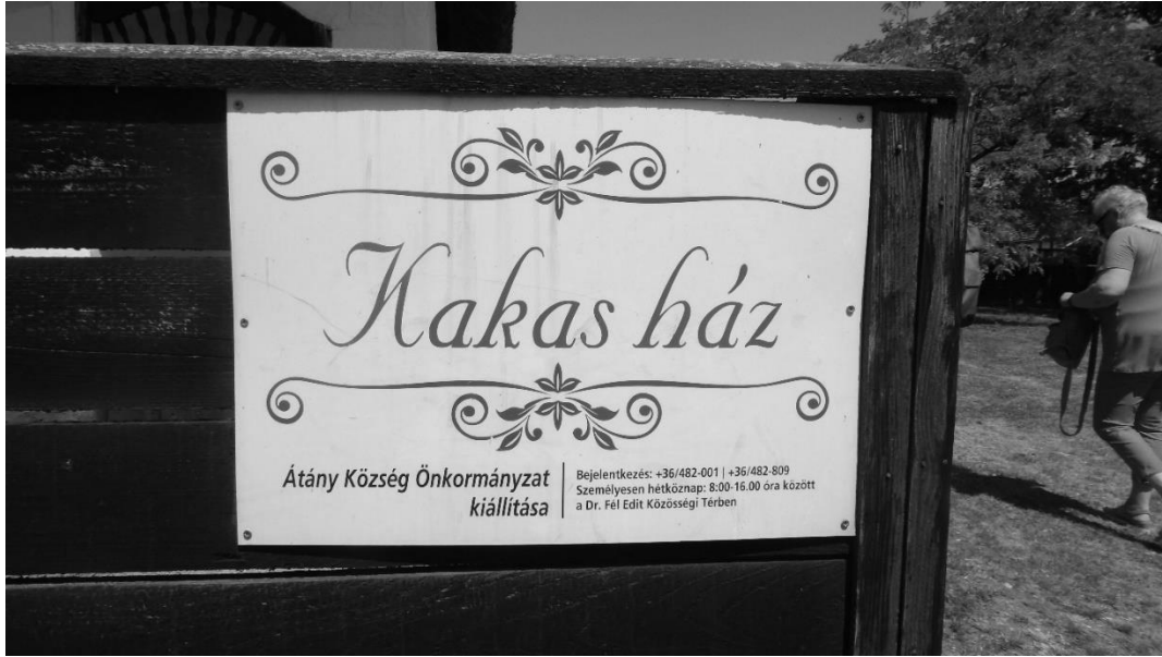
1. kép: Innovatív kezdeményezés: Kakas-ház