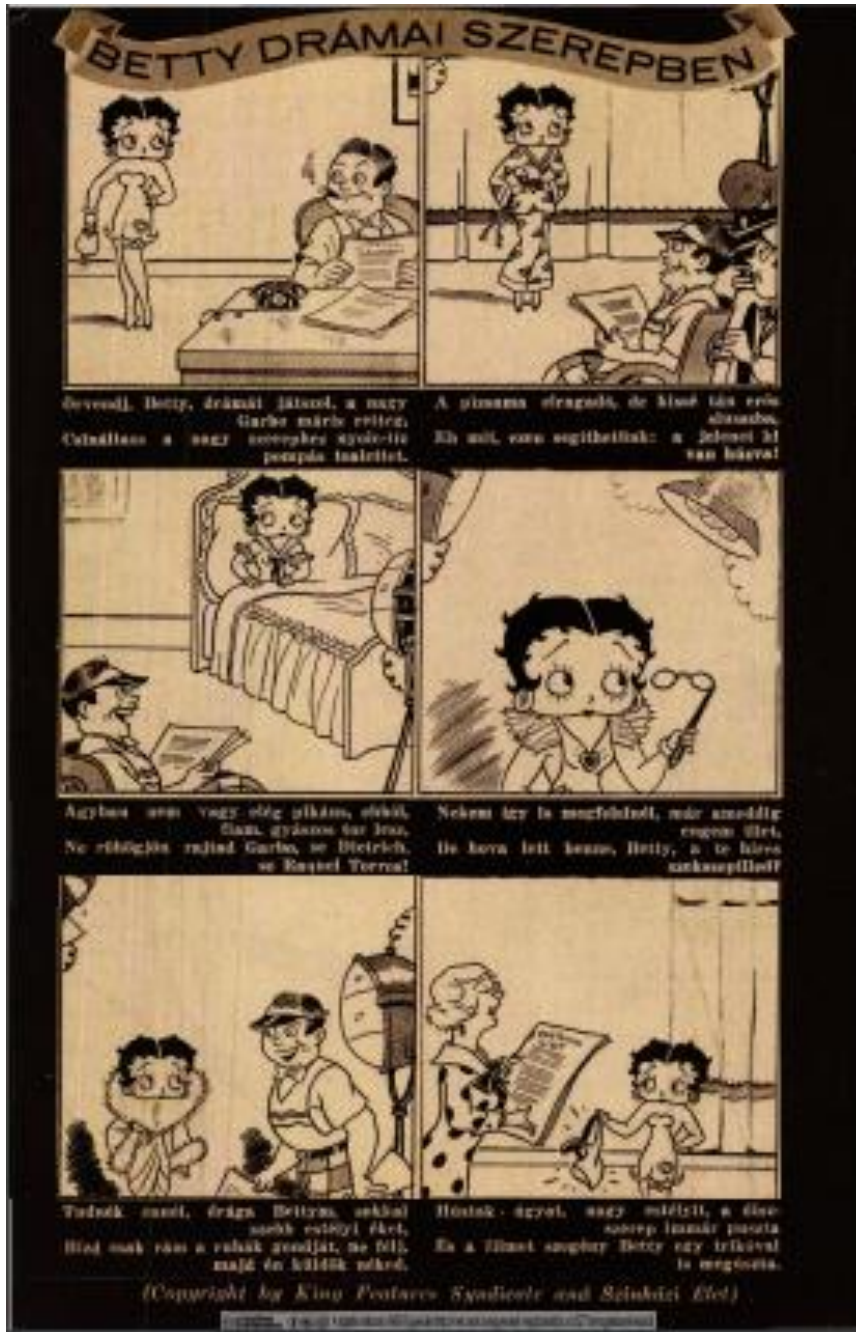
7. kép: Betty drámai szerepben (Betty Boop. King Features) Forrás: Színházi Élet, 1935. 18. p. 58.