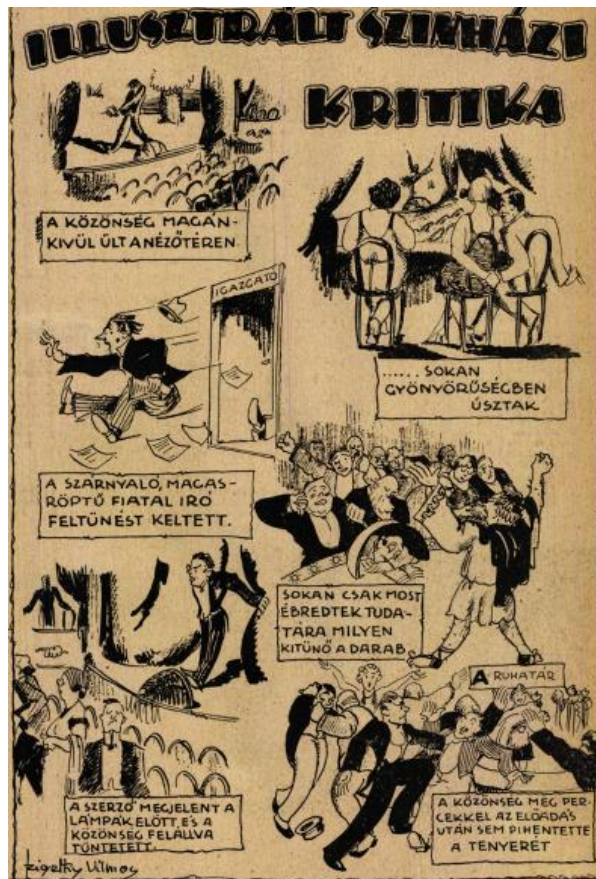
2. kép: Illusztrált színházi kritika (rajz: Szigethy Vilmos) Forrás: Színházi Élet, 1925. 44. szám. p. 57.

mezéséhez. A képalírásokban kulcsszerepet kap a nyelvi komikum, amelyekben a szójáték, vagy a képet árnyaló humoros kiszólás hordozza ezt a hatást. E képsor esetében a helyzet- és a nyelvi komikum együttese árnyalja vagy fokozza a képkockák komikus hatását. A hat képkocka közül talán az első kép-szöveg kombináció a legszellemesebb. A képen egy színházi jelenetet látunk, és szinte üres nézőteret, egyetlen nézővel. A képalírás szövege a következő: „a közönség magánkívül ült a nézőtéren”. Ha megvizsgáljuk ezen a példán a kép és szöveg viszonyát, azt mondhatjuk, hogy egy hozzátevő kombinációt látunk, ahol a szó erősíti a képet, ugyanakkor kölcsönös összefüggés is van a kép és szöveg között, hiszen a kettő együtt hordoz többtűzenetet. A komikus hatást tovább fokozza a szöveg többértelműsége, szójátékjellege.