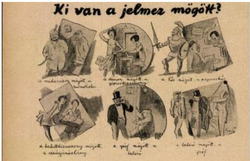
6. kép: Ki van a jelmez mögött? (rajz: Gedő Lipót)

Gedő Lipót képsorozata azt az örök színházrajongói kíváncsiságra, attitűdre utal, amikor a közönség minél többet szeretne tudni arról, hogy mit csinál a színész, amikor nem a színpadon játszik. Az egyes rajzok szerkezetileg az ellentételezésre épülnek, a humor forrása minden képkockánál abban rejlik, hogy egy adott színpadi szerep képi megjelenítése mögött – keretezett formában – a szerepkörrel ellentétes státusz, tulajdonság vagy hétköznapi tevékenység jelenik meg. (Például az első képen a maharadzsaát játszó színésze kiderül, hogy a magánéletben pénztelen [mimolista], a harmadik képen látható, hőst játszó színész pedig otthon papucshős.)