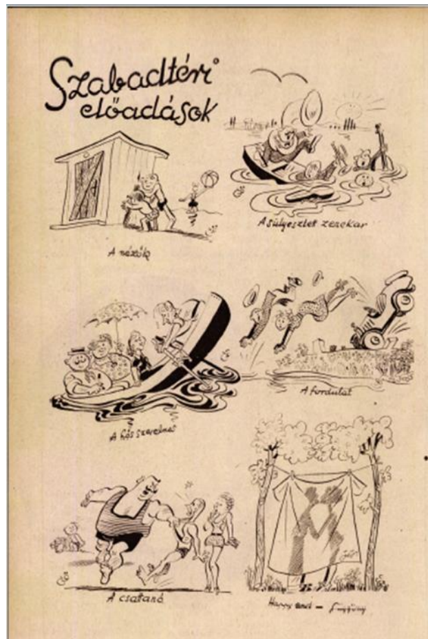
5. kép: Szabadtéri előadások (rajz: Gömöry Holstein Imre)

Gömöry Holstein Imre Szabadtéri előadások című képregényében a képkockák közötti átmenettípusok alapján „jelenetről jelenetre” szerkezetet látunk, vagyis térben és időben távol eső történéseket látunk, és a jelenetek közötti összefüggésteremtést, illetve a képek közötti események, előzmények kitalálását az alkotó a befogadó fantáziájára bízta. A képek és a szavak között itt is kölcsönös összefüggés van, mert a kettő együtt közvetít egy olyan üzenetet, amelyre egyedül sem a rajz, sem a képaláírás nem lenne képes. A képeken a szabadtéri előadások váratlan helyzeteire látunk egy-egy szellemes példát. A komikus hatás alapján véleményem szerint a második és a negyedik hordoz igazán eredeti, egyedi ötletet, megoldást. A második képen az előadásban szereplő zenekar egy tó közepén, csónakban zenél, és éppen a csónak süllyedésének pillanatát látjuk. A képaláírásban a következő olvasható: A süllyesztett zenekar. A negyedik képen a jelenetben szereplő pár éppen kirepül az autóból egy kocsikázós jelenetben. A képaláírásban egy rövid, de sokatmondó szöveg olvasható: A fordulat. Az előző képaláírás egyszerre utal egy színházi jelenet fordulatára és a szabadtéri előadás váratlan fordulatára.