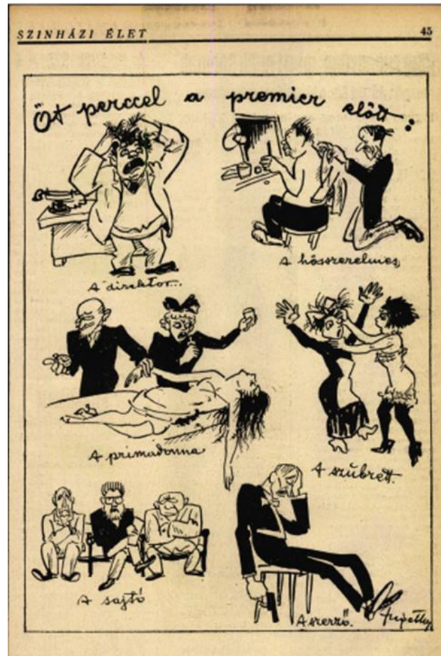
1. kép: Öt perccel premier előtt (Szigethy István rajza)