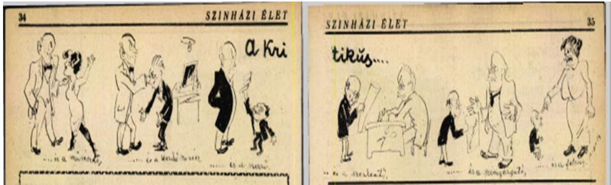
3. kép: A Kritikus és... (rajz: Szigethy István)