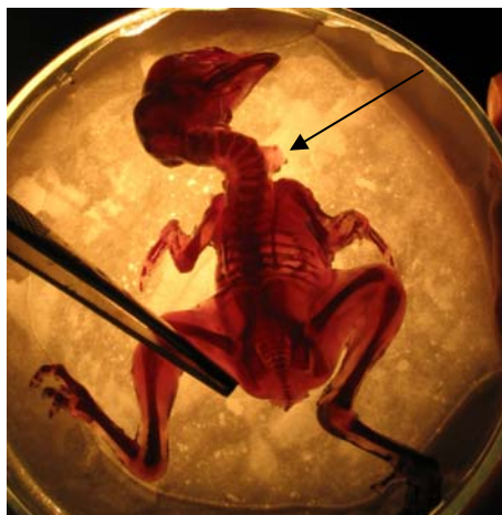
Figure 3: Type of developmental anomalies from the teratogenicity test after the painting (curved neck)

Az alkalmazott peszticidek madárteratológiai vizsgálata során (a csontvázfestett embriók esetében) tapasztalt fejlődési rendellenesség (görbült nyak)