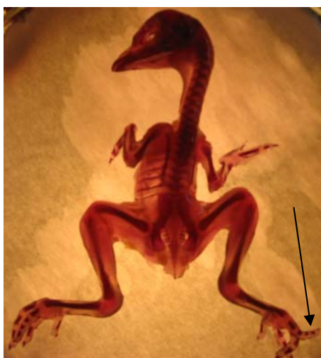
Figure 4: Type of developmental anomalies from the teratogenicity test after the painting (deformed leg)

Az alkalmazott peszticidek madárteratológiai vizsgálata során (a csontvázfestett embriók esetében) tapasztalt fejlődési rendellenesség (végtag deformitás)