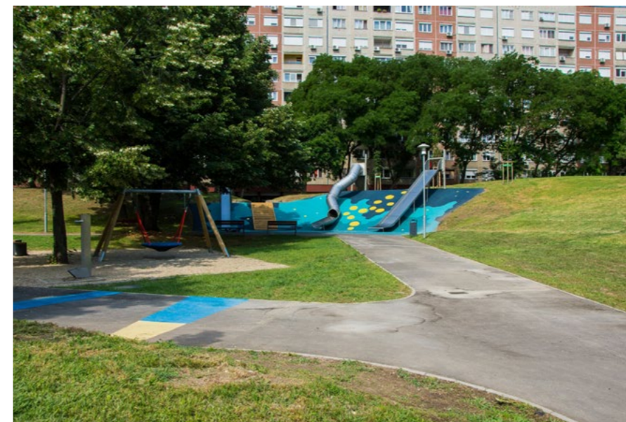
9. ábra/Fig. 9: Jubileumi park az 1960-as évek végén, Budapest XI. kerület / Jubileumi park at the end of 1960s, 11th District, Budapest