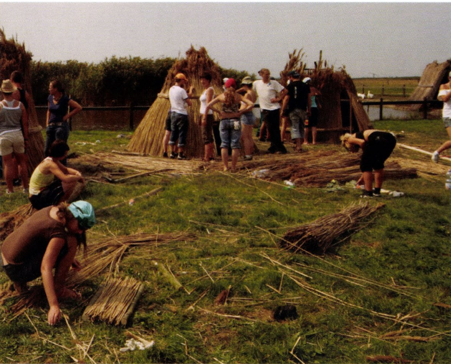
3. kép: A konferencia hét fő helyszíne