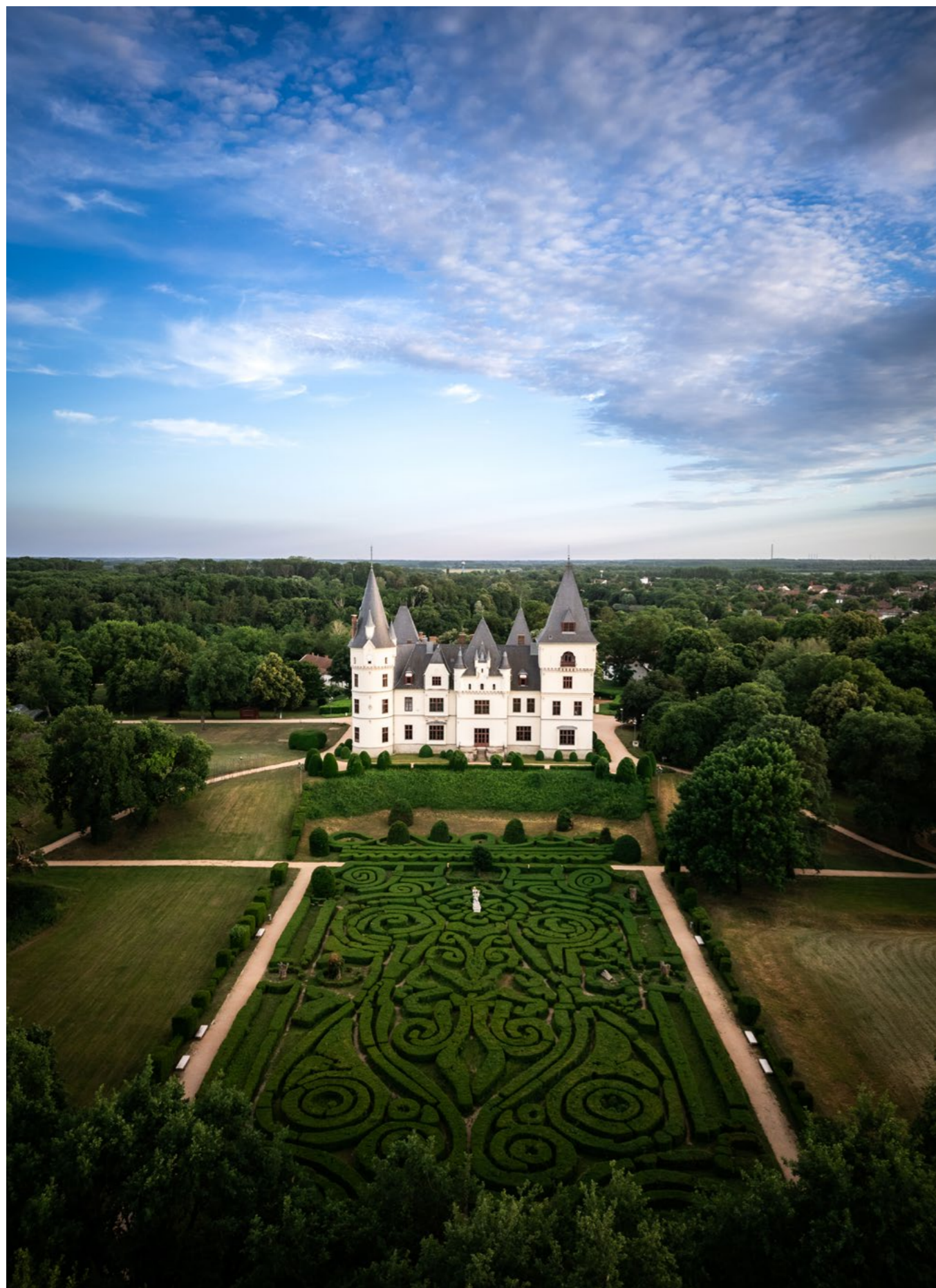
16. kép/Fig. 16: Tiszadob Andrassy-kastély parkjának helyreállítása, tervező: Németh Zita, Remeckzi Rita (NÖF Nonprofit Kft.), átadás: 2022 / Figure 16. Restoration of the park of Andrassy Castle in Tiszadob, designer: Zita Németh, Rita Remeckzi (NÖF Nonprofit Ltd.), handover: 2022