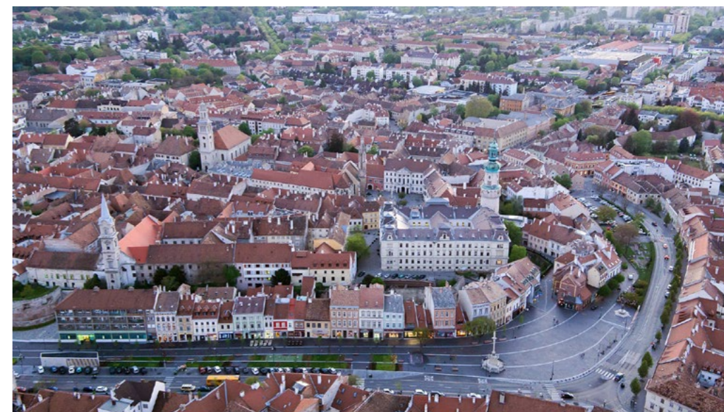
◀◀2. kép/Fig. 2: Gyula, Kossuth tér, tervezők: Andaházy László, Turcsányi Katalin, Botka Szilvia (Panda Pont Kft.), átadás: 2006. / Kossuth Square, Gyula, designed by László Andaházy, Katalin Turcsányi, Szilvia Botka (Panda Pont Ltd.), handed over in 2006,