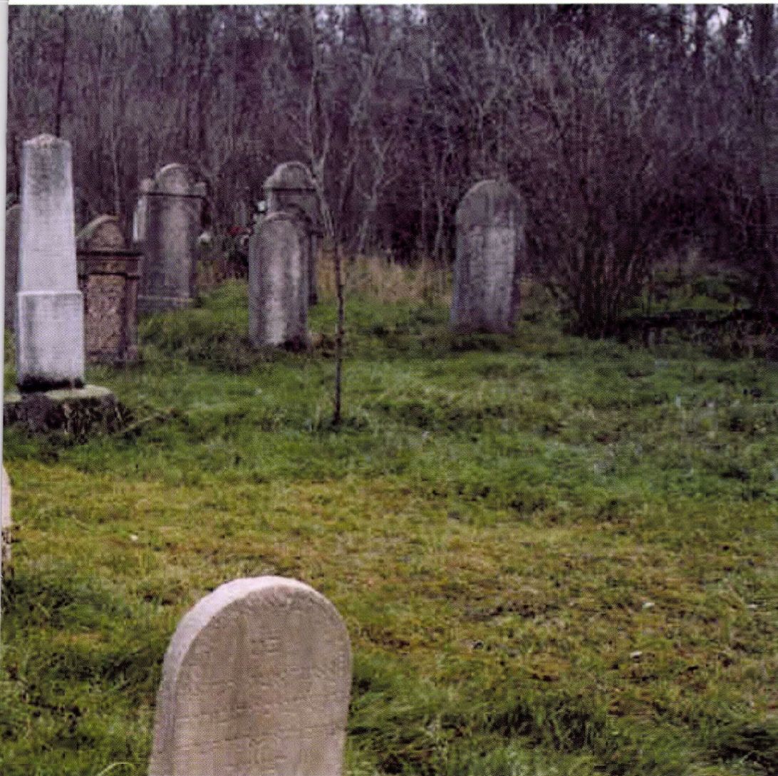
5. kép: A helyi védelem alatt álló öcsödi zsidó temető