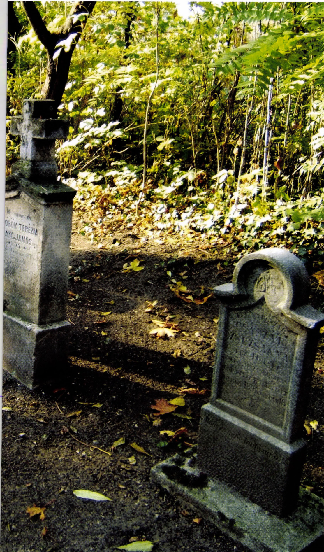
4. kép: Összegyűjtött régi sírkövek az agárdi temetőben