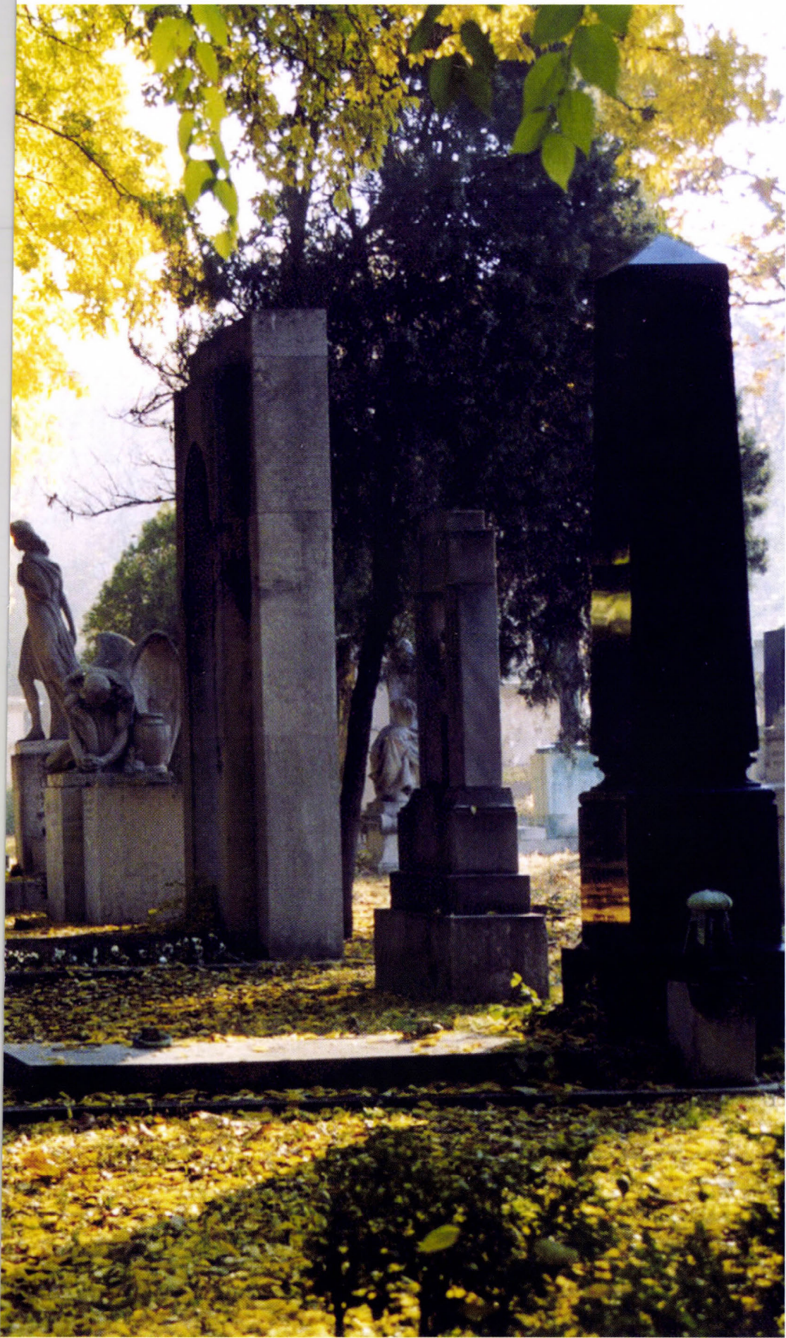
1. kép: A budapesti Kerepesi temető védett sírjai