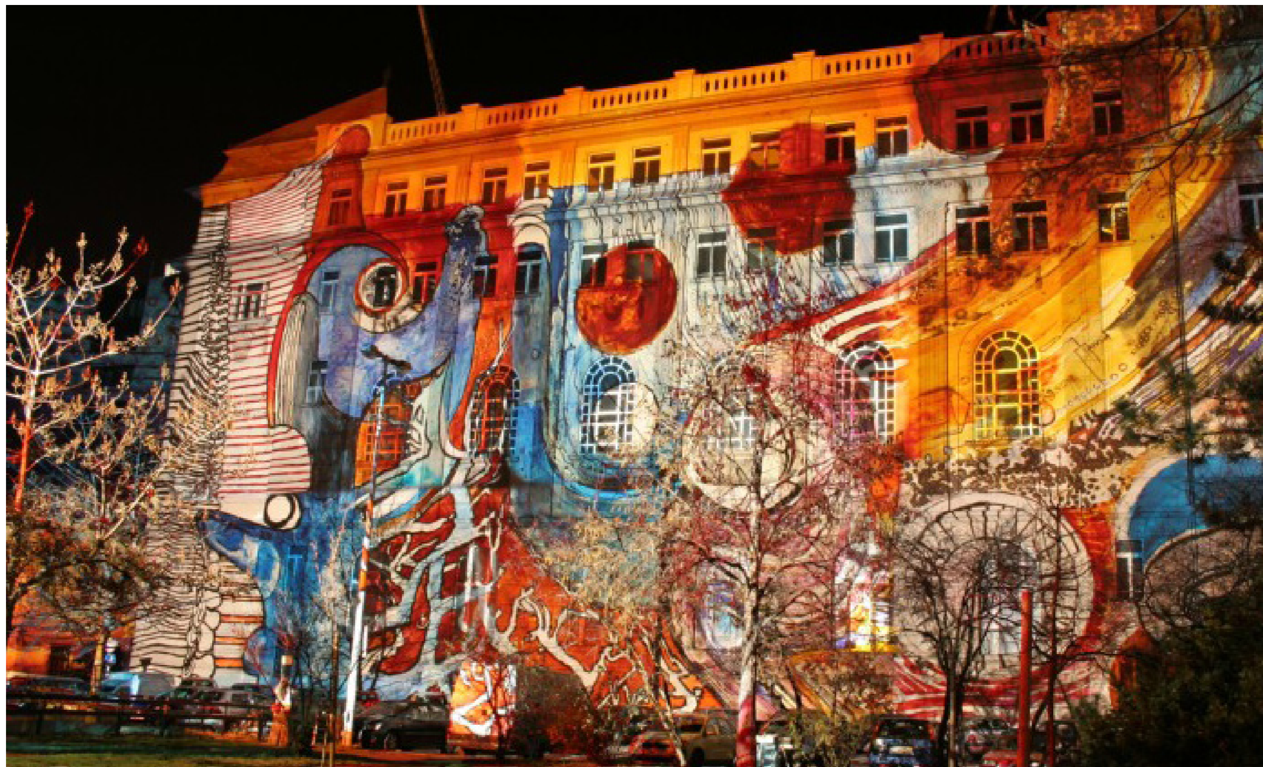
11. kép: Raypainting, Budapest, 2006. december A Dork & Kozma alkotópáros ismert fényfestései jó példák a közterek időszakos, intenzíven vizuális átalakítására.

hatékony – illetve hatékony-e egyáltalán, de a témával foglalkozó számtalan tudományos munkának még a számbavétele is meghaladná ezen írás kereteit. Kiemelendők azonban azok a művészeti projektek, amelyek a lakosság bevonásával kísérelték meg átprogramozni, újraértelmezni a megüresedő városi területek, a kiürülő lakóépületek és közterek jelentését és lehetőségeit. 6