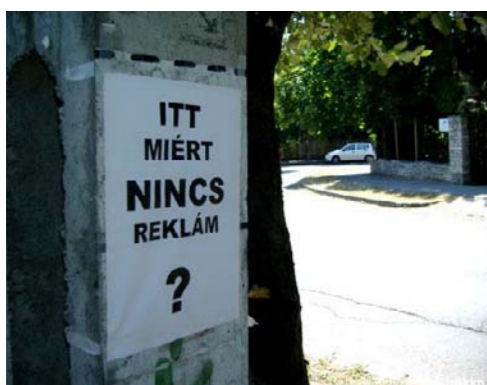
4. kép: Add-on, Bécs, 2005. Publikus privátszféra, avagy lakható nyilvános tér.

Jelen tanulmány a „városi események” (urban event) és a köztéri művészeti tevékenységek kapcsán közéleti és várospolitikai összefüggéseket vizsgál. Annak definiálásától, hogy mi a művészeti- és mi a köztér eltekint, inkább a téma néhány fontosabb kérdéskörét emeli ki. Mi az, amit lehet egy köztéren és mi az, amit nem? Hogyan függenek össze a közterekkel kapcsolatos társadalmi attitűdök és a köztéri események? Hol kezdődik és hol ér véget a tervezés, a szabályozás szerepe? 1