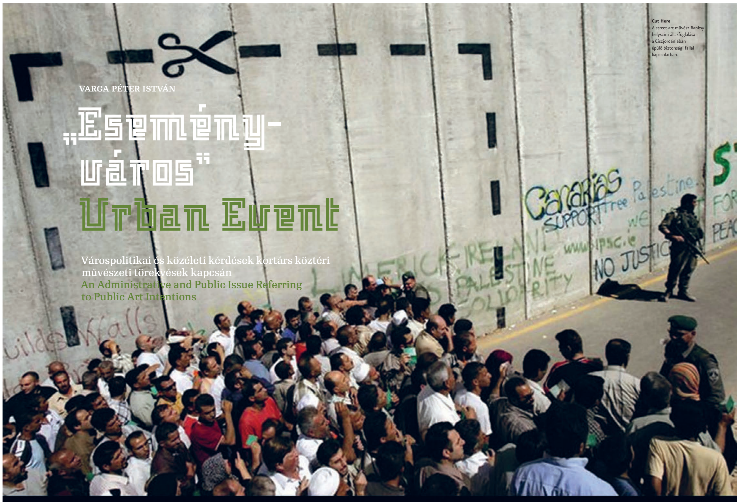
Cut Here A street-art művész Banksy helyszíni állásfoglalása a Ciszjordániában épülő biztonsági fallal kapcsolatban.