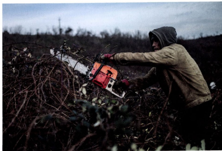
Monor called Tabán. The Jelenlét („Presence”) Programme of the Hungarian Charity Service of the Order of Malta has been in operation here for ten years