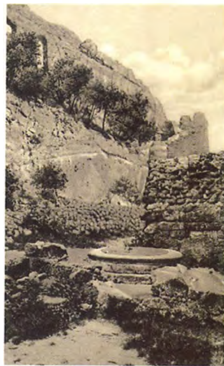
Visegrád Várromok a kúttal – Stranne und Burgruine

Az értékvédelem fontosságát a turizmus kedvezőtlen környezeti hatásaival szemben világszerre a természetvédelem ismerte fel leghamarabb, és talán a leghatékonyabb intézkedések is ehhez kapcsolódnak. A nemzeti parkok a turista-tevékenység irányításával és ellenőrzésével, a különböző védetségű fokozatot biztosító zónák kijelölésével a turizmus a természetre és a művi környezetre gyakorolt kedvezőtlen hatásait minimalizálni tudják, de a természetvédelem érdekeinek az érvényesítése és az ökoturizmus fejlesztése, elég nehezen megvalósítható feladat. A turisztikai terhelésvizsgálat szükségességét egyre inkább hangsúlyozzák a fenntartható turizmus fejlesztői, kutatói, kiemelve, hogy a turizmus saját érdeke a terhelésvizsgálatok elvégzése. A turizmus hatásairól, legyen az gazdasági, társadalmi, vagy környezetim, sokat lehet hallani. Általában arról esik szó, hogy mit kell vizsgálni, mik lehetnek a lehetséges hatások, hogy mire kell figyelni, azzal viszont ritkán találkozhatunk, hogy hogyan. (Pénzes E. 2006) A turisztikai terhelésvizsgálattal azt lehet megállapítani, hogy az adott területen milyen hatással van a turizmus az egész természeti-társadalmi-gazdasági