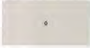
6. kép Átnézetű helyszínrajz

legfőbb térszerkezeti problémája jól tükrözi a Belváros egészének problémáját. Az Erzsébet híd - Szabadsajtó út Kossuth Lajos utca - Rákóczi út által meghatározott tengely gyalogos használat szempontjából mind a teret, mind a Belvárost kettévágja. A diplomaterv többek között ennek a problémának a megoldására is kitér.