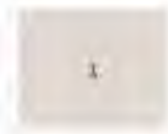
1. kép Légi felvétel a római castrum körvonalának rajzával